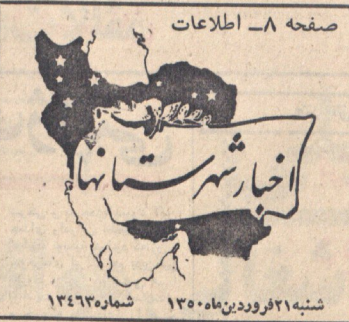
صفحه ۸ - اطلاعات شنبه ۲۱ فروردین ۱۳۸۵