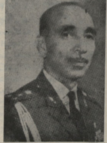
پیشین دیروز مراسم در سان فرودگاه شیراز بحضور آقای صدری استاندار فارس ، تیمسار سپهبد ضریح فرغانه ارتش سوم و رؤسای سازمانهای دولتی و سرشناسان و مدیران روزنامه ها

دهم محرم هر سال یادآور خاطره فراموش ناشدنی روزی است که کوس پرواز مجددهوا پیمای جت در فرودگاه شیراز