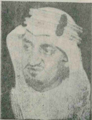
مدتهاست که اعلیحضرت ملک فیصل پادشاه عربستان سعودی سعی و کوشش

دارد که روابط نزدیکتری میان ملل و کشورهای اسلامی بوجود بیاورد ولی برخی از سران مسلمان عرب که باصلاح خود را انقلابی و مترقی میدانند با این امر از در مخالفت برخاسته اند.