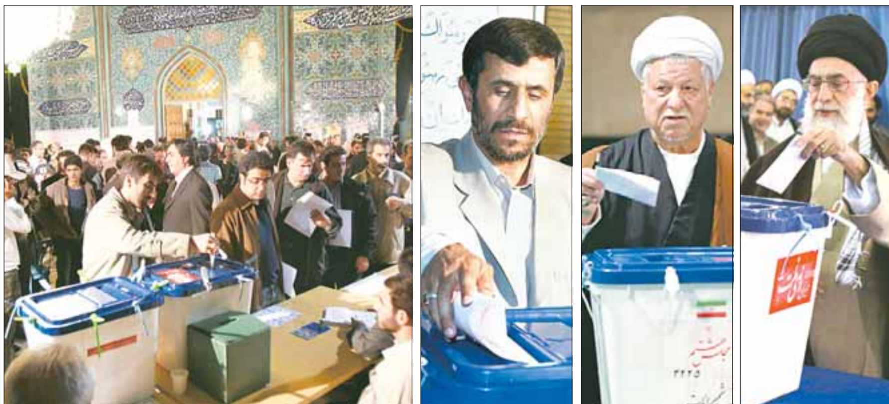
مقام معظم رهبری به هنگام انداختن آرایشان در صندوق سیار ۱۱۰: