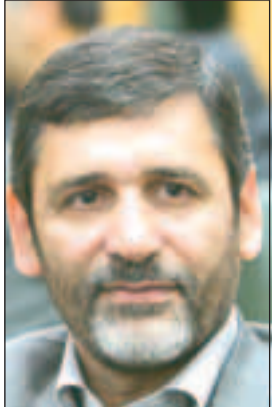
هنر روا شود.

وی با اشاره به صفت «تصویرگری» خداوند در قرآن خطاب به هنرمندان جوان حاضر در این آیین گفت: شما در یک کار خدایی وارد شده اید و این سرآغاز نهضتی در هنرهای تجسمی ما خواهد بود، یعنی از این پس سرمایه های بسیاری در معاونت هنری و در اداره کل هنرهای تجسمی وزارت ارشاد صرف می گردن استعدادهای جوان خواهد شد بی آنکه ذره ای از اکرام استادان و برجستگان هنری کاسته شود و یا ناسپاسی نسبت به قدر و منزلت افتخارآفرینان عرصه