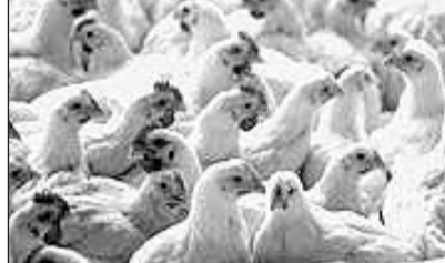
زنجانخبرنگار اطلاعات:معاون امور دام سازمان