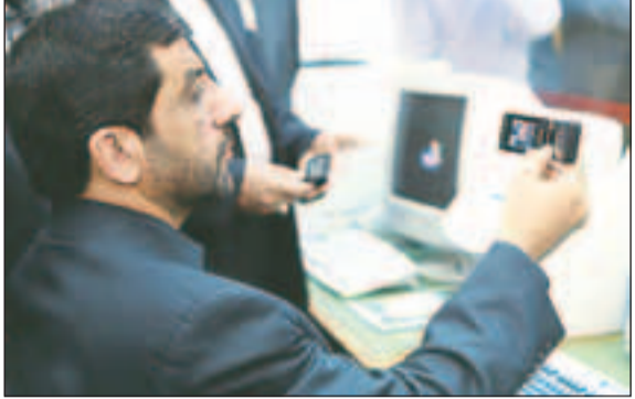
عین حال مداوم

سیگنال دیجیتال برای گیرنده های متحرک، شهروندان تهرانی می توانند شبکه های مختلف ملی و برخی شبکه های فراملی جمهوری اسلامی ایران را بر روی گیرنده های متحرک فراملی جمهوری اسلامی ایران را بر روی گیرنده های متحرک در داخل خودرو و یا گوشی های تلفن همراه دریافت کنند.