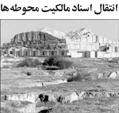
اهوازخبرنگار اطلاعات:یکی از مصوبات سفر استانی هیات دولت تهیه و ارائه پیشنهاد در زمینه نحوه