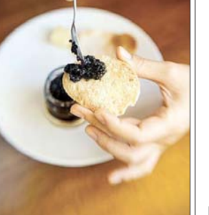
فرآیند استخراج ماهی خاویار

ماهیان خاویاری، تنها ۵ هزار تن ماهی در سال در دنیا تولید می شود که تقریباً نیمی از آن در کانادا، کشور یکسک، کبک، تولید می شود. ماهیان خاویاری در آبهای سرد و عمیق زندگی می کنند. ماهیان خاویاری در آبهای سرد و عمیق زندگی می کنند.