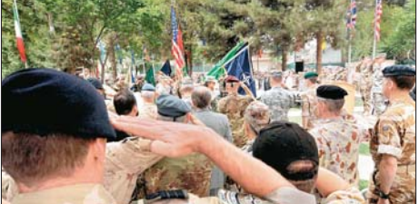
مراسم تفریبش فرماندهی نیروهای ناتو و آمریکا در افغانستان به ژنرال «مک کریستال» - عضو ازبک خبرگزاری فرانسه