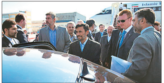
عکس: ابراهیم نوروزی - خبرگزاری فارس * رئیس جمهوری در حاشیه اجلاس با رؤسای جمهوری چین و روسیه دیدار و گفتگو می‌کند