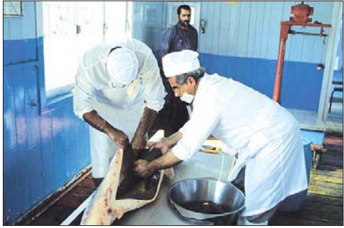
تیم تخصصی در حال آماده سازی ماهی خاویار در شرکت ماهی خاویار پارس

چرا مهم بودن ماهی خاویار، فقط با این بارها کارنها بودنش باشد؟ چرا این زوی میریبه چند میلیون ساله که در استانه نابود فرار دارد، نباید تنها برای آن که در محموله زنده است، اهمیت داشته باشد؟ چرا سرشت آن ماهی زدرخی - به هرف این که خاویار نمی خورد - نهی از اهمیت است و نه تلهوژن طبیعت، بی آن دل می برداند؟