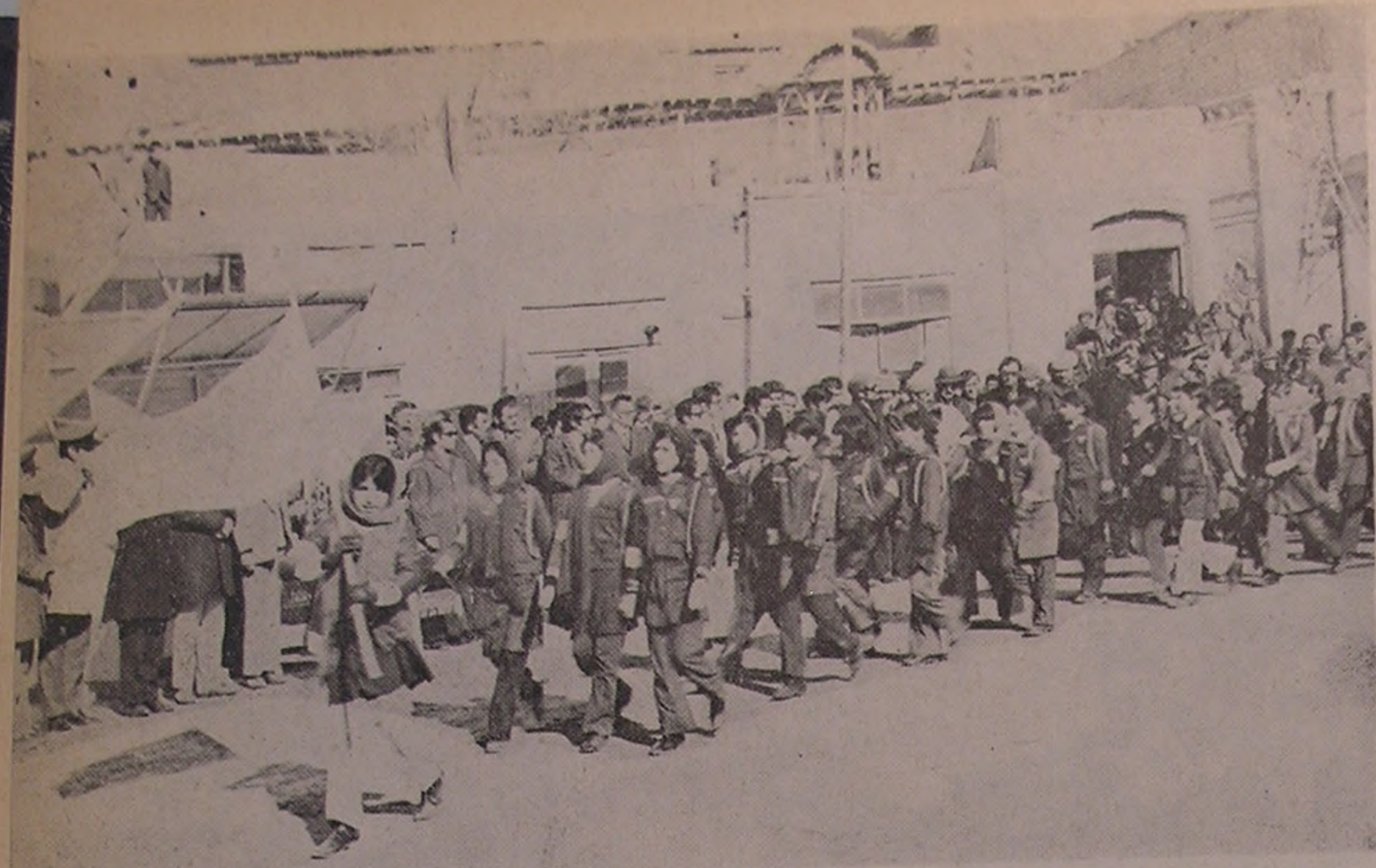
فیروزکوه . . . دموستراسیون جوانان شیر و خورشید سرخ