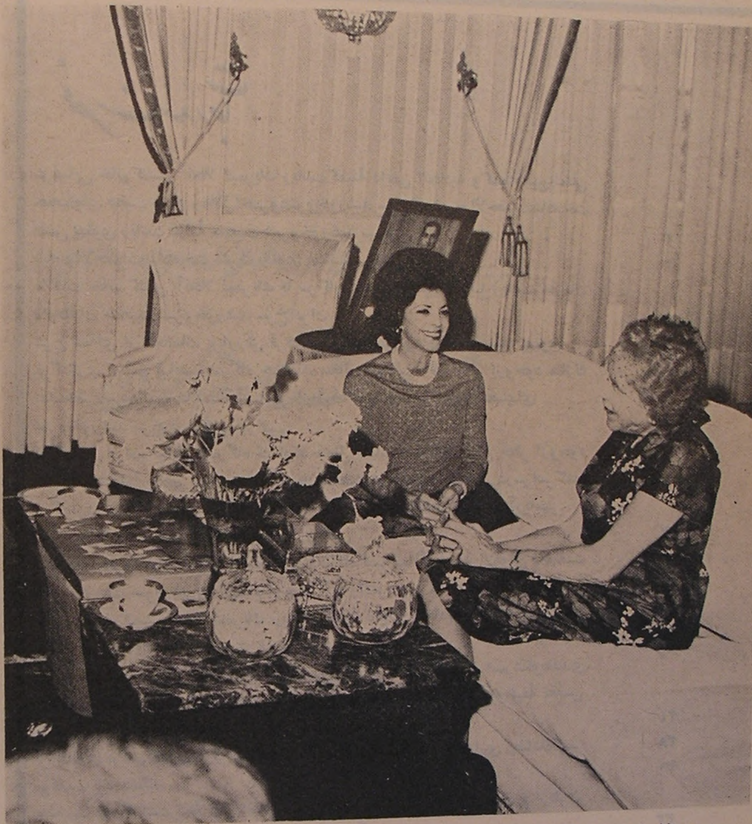
والاحضرت شاهدخت شمس پهلوی ریاست عالیة جمعیت شیروخورشید سرخ ایران با خانم کنس لیمریک مذاکره میفرمایند

جمعیتهای صلیب سرخ، هلال احمر و شیروخورشید سرخ