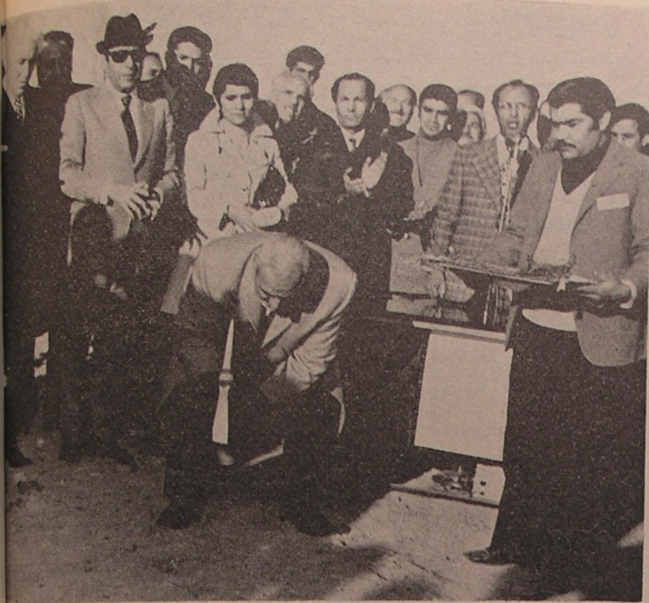
بنام نامی شاهنشاه آریامهر اولین کلنگ ساختمان آموزشگاه بهیاری شیر و خورشید سرخ قم بر زمین زده میشود