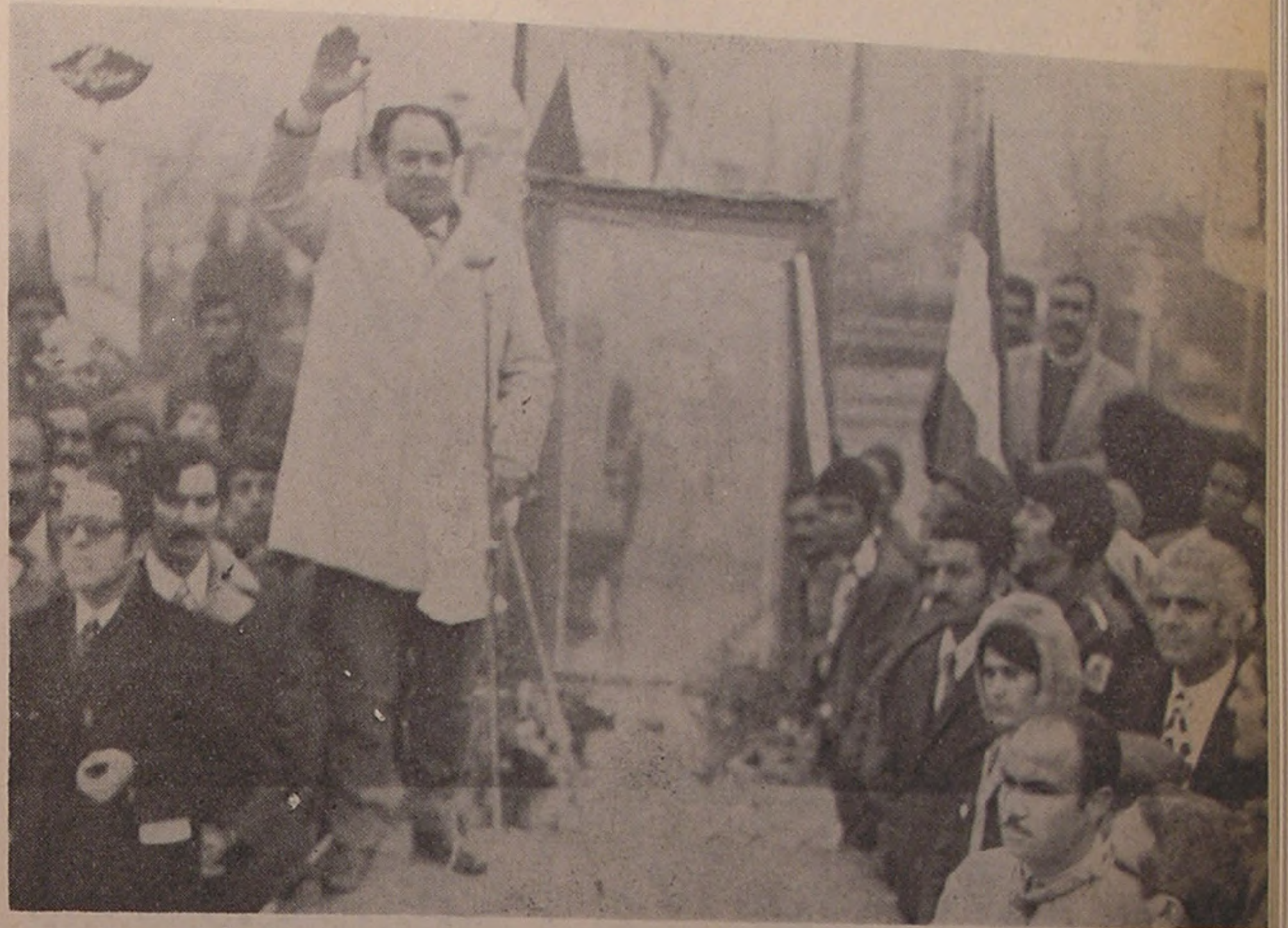
خمین . . . سخنرانی مدیرعامل جمعیت شیرو خورشید سرخ خمین در مجلس جشن این جمعیت

he White ed out at ghout the On the ters were