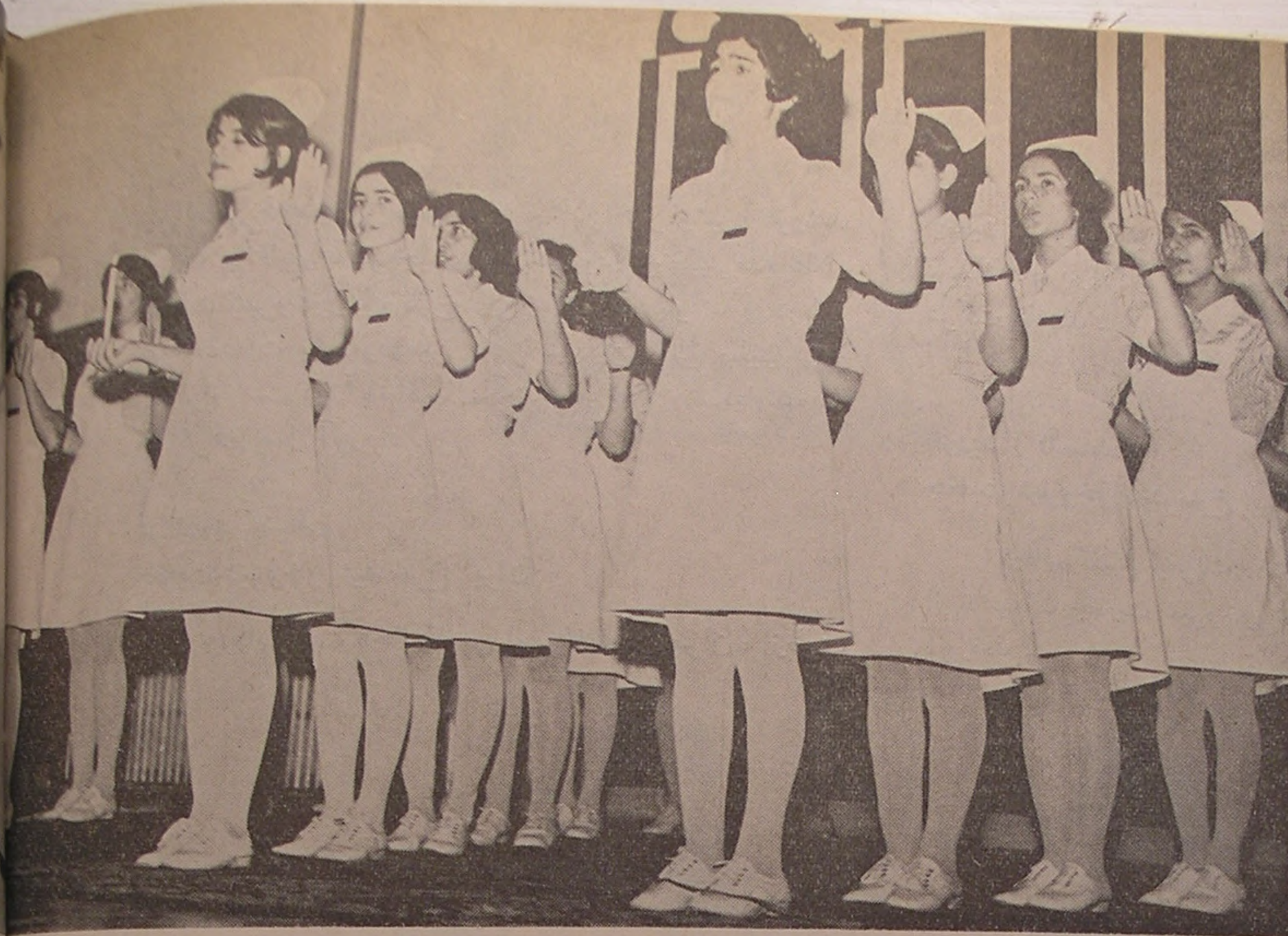
سمنان . . . ادای سوگند پرستاری