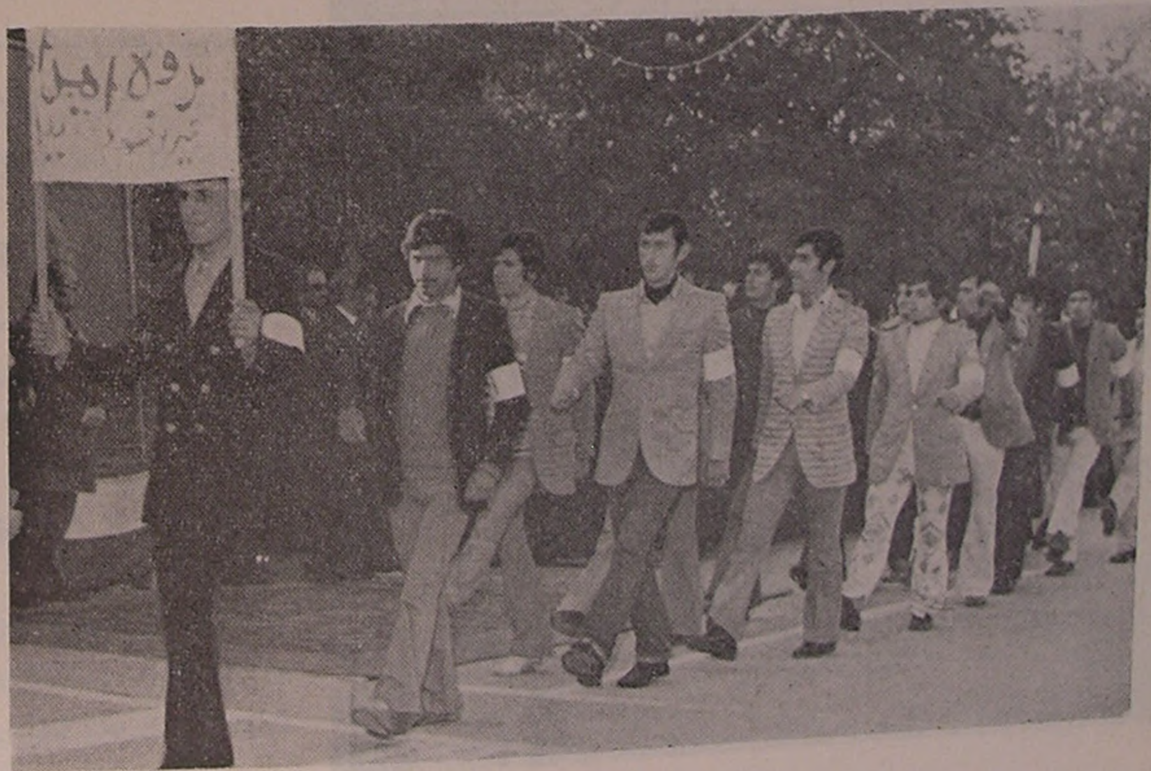
شہسوار . . . دمونستراسیون جوانان شیر و خورشید سرخ