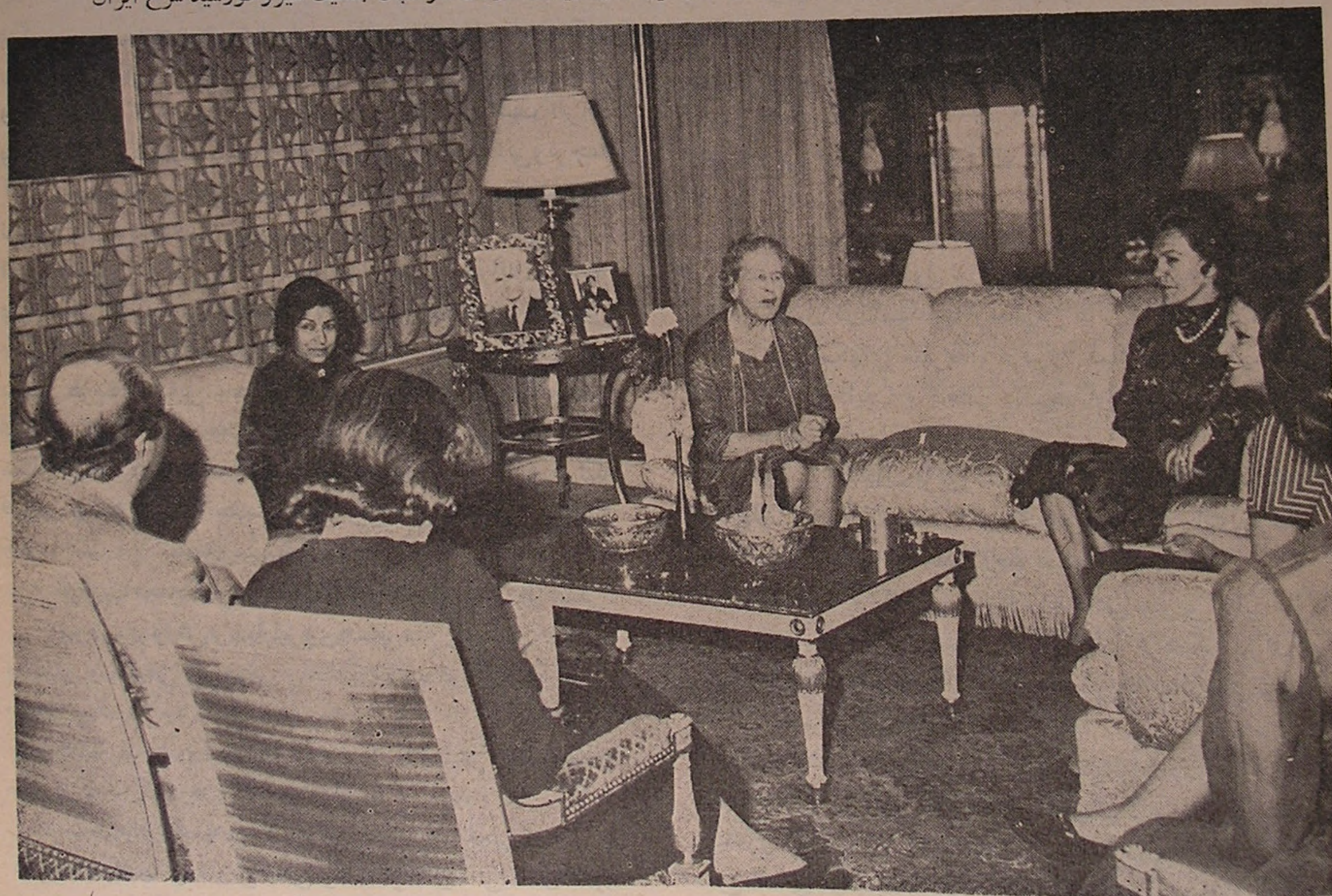
منظره ای از جلسه ملاقات خانم کنتس لیمریک با سرکار علییه بانو فریده دیبا ریاست سازمان داوطلبان جمعیت شیروخورشید سرخ ایران

بعد از ظهر روز یکشنبه بیست و هفتم اسفندماه، خانم کنتس لیمریک، ریاست کمیته دائمی اتحادیه و کمیته بین المللی جمعیتهای صلیب سرخ، هلال احمر و شیر و خورشید سرخ، بحضور سرکار علییه خانم فریده دیبا، ریاست سازمان داوطلبان جمعیت شیروخورشید سرخ ایران رسیدند. در این دیدار که آقای دکتر خطیبی مدیر عامل جمعیت