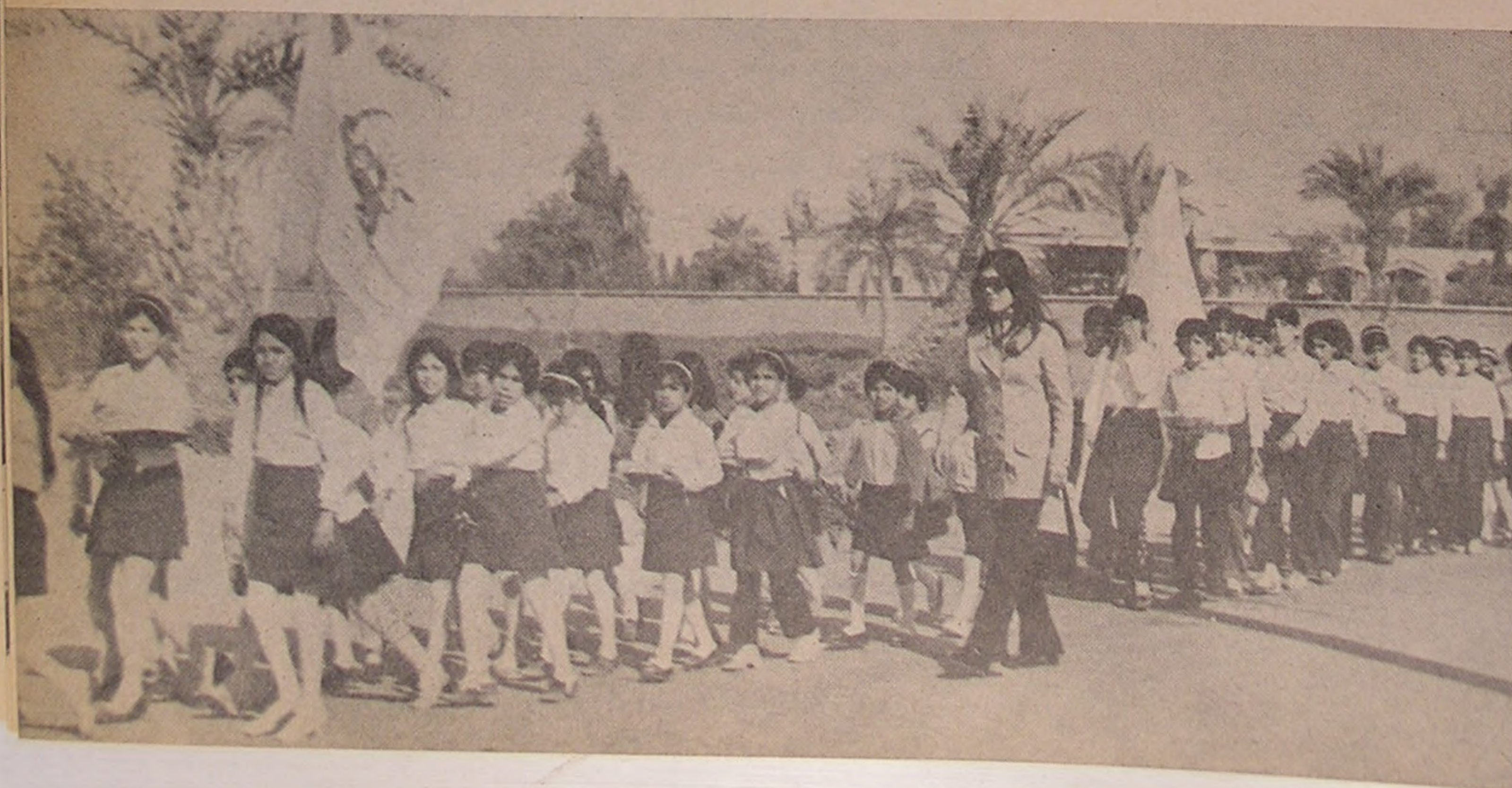
رامهرمز . . . دمو نستر اسیون دوشیزگان عضو سازمان جوانان