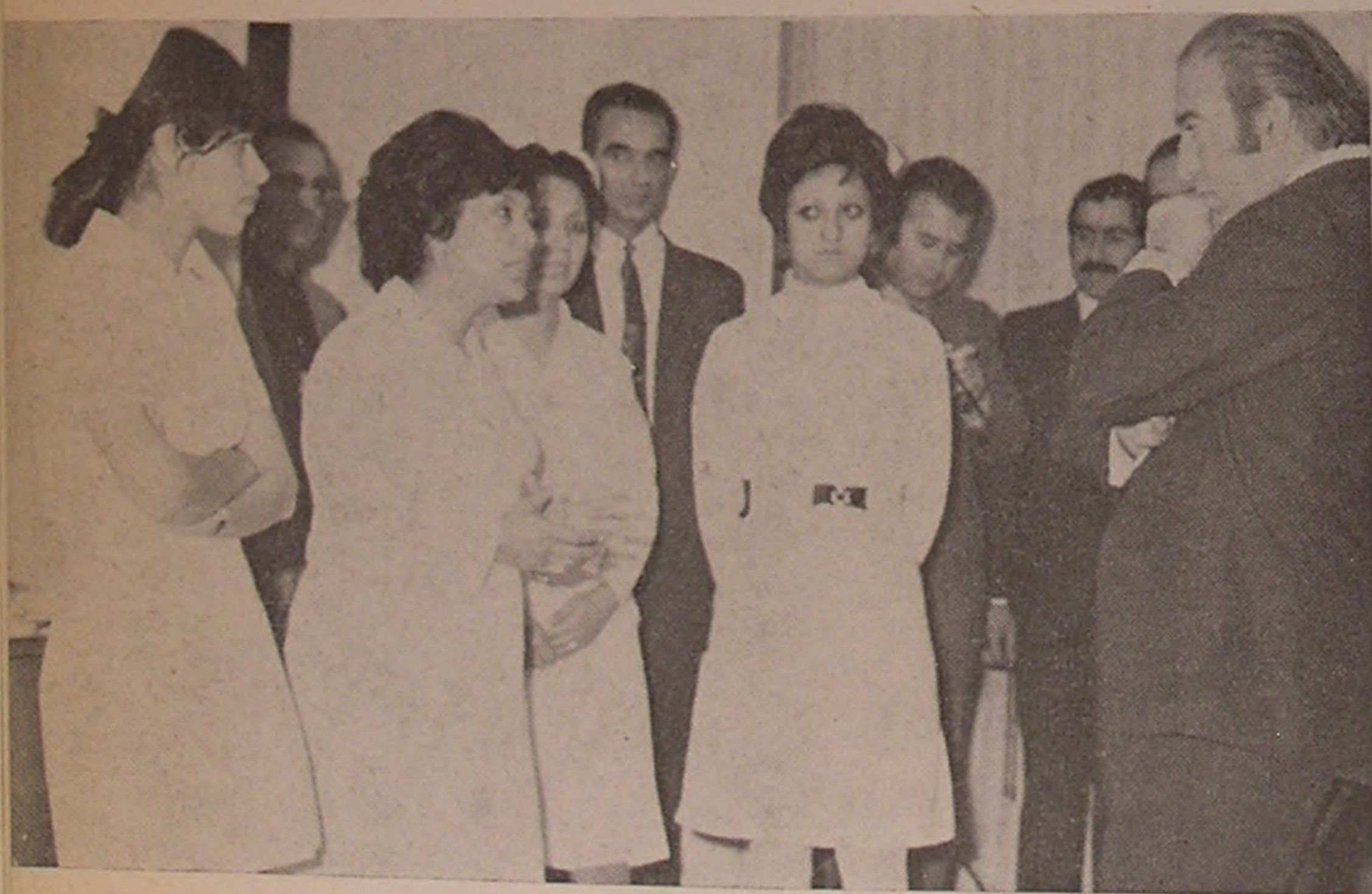
گرگان . . . تجلیل از خدمات پرستاران شیر و خورشید سرخ