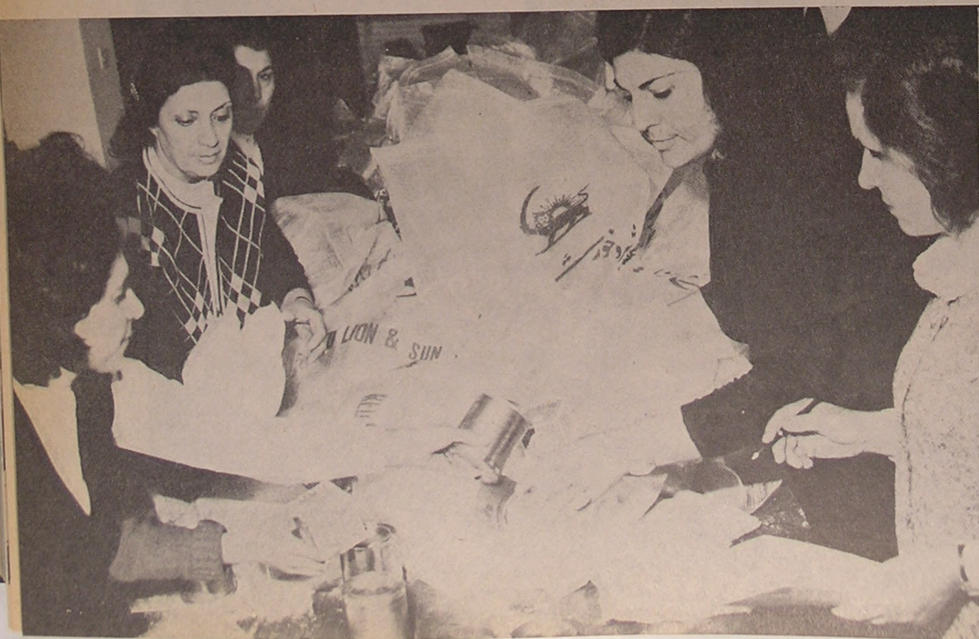
تهران ... آماده نمودن هدایای شیر و خورشید سرخ وسیله جوانان برای توزیع بین بیماران بیمارستانها و خانواده‌های کم‌بضاعت

بمناسبت سالروز میلاد مسعود اعلیحضرت رضاشاه کبیر بنیانگذار ایران نوین و جمعیت شیر و خورشید سرخ ایران، روز بیست و چهارم اسفند ماه از طرف جمعیت مرکزی جوانان شیر و خورشید سرخ و جمعیت‌های جوانان شیر و خورشید سرخ در سراسر ایران، طی مراسم شکوهمندی که برگزار گردید، از مقام ارجمند اعلیحضرت رضاشاه کبیر تجلیل بعمل آمد.