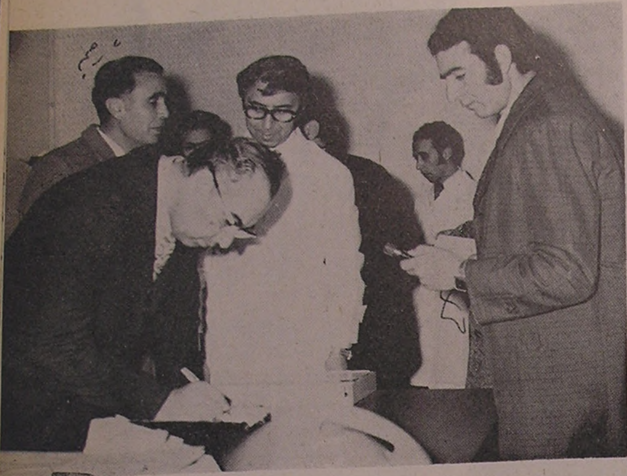
میان دو آب . . . امضاء دفتر یادبود بیمارستان شیر و خورشید سرخ وسیله آقای استاندار