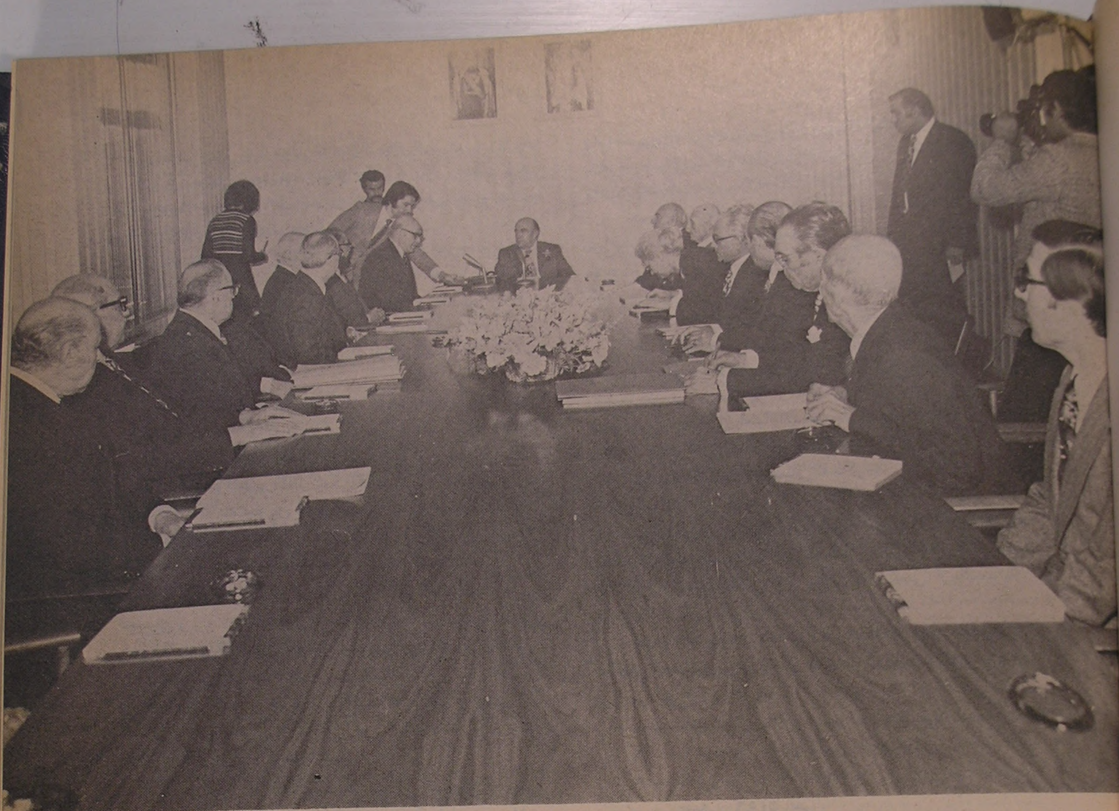
منظره‌ای از جلسه هیئت نظارت بر موقوفات بنیاد پهلوی

اکثر فارغ‌التحصیلانی که در رشته‌های علمی و فنی و صنعتی و پزشکی و کشاورزی تحصیل کرده‌اند، به تناسب رشته تحصیلی در دانشگاه‌های کشور، در سازمان برنامه، وزارتخانه‌های آب و برق، پست و تلگراف، کشاورزی و آبادانی مسکن، شرکت ملی نفت، شرکت ملی ذوب آهن و مؤسسات دیگر دولتی و یا بخشهای خصوصی، بخدمت مشغول شده‌اند و در راه پیشرفت و سازندگی کشور عوامل مؤثر بشمار می‌روند. در تمام دوران تحصیل دانشجوی در خارجه، «بنیاد پهلوی» با دانشجو و خانواده او و در مورد لزوم با دانشکده وی در تماس است و پرونده تحصیلی هر دانشجو بعد از هرامتحان رسبستگی میشود در هر مورد نقص وضعی در نمره مشاهده شود، با دانشجو و ولی او تذکرات لازم داده میشود و در مواردی که دانشجو نمرات عالی کسب کرده باشد، تقدیر میگردد. عده‌ای از این جوانان فاضل که موفق باخذ درجات علمی از دانشگاههای بزرگ جهان شده‌اند، فرزندان روستائیان نقاط