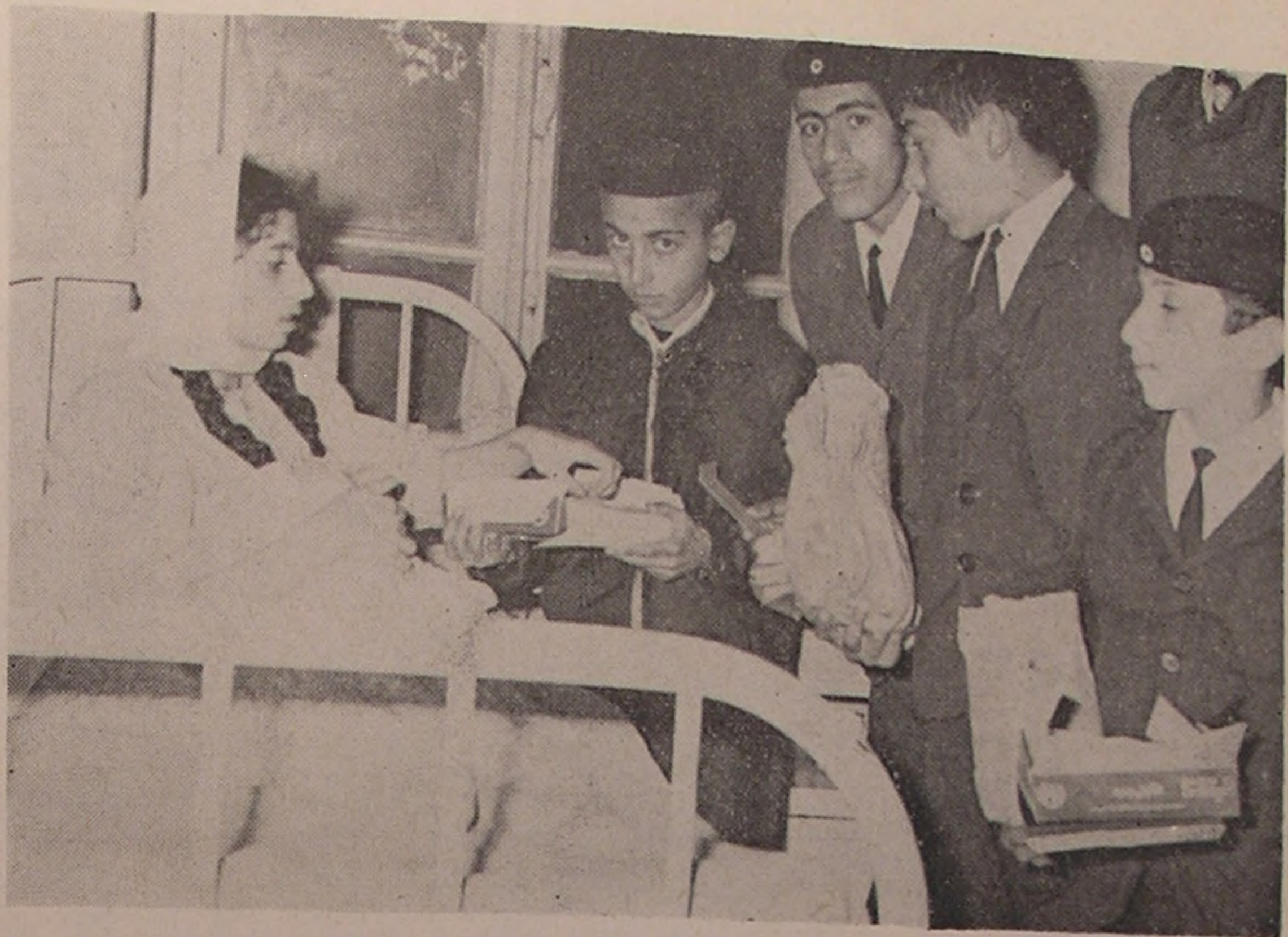
شہسوار . . . توزیع ہدایای شیرو خورشید سرخ بین بیماران