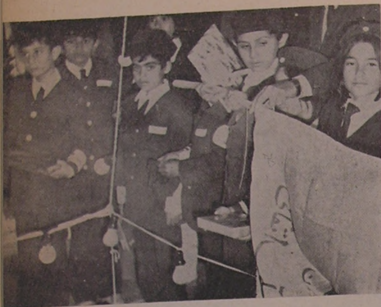
بیم ... توزیع هدایای شیر و خورشید سرخ وسیله جوانان

رادمردی که بفرمان تاریخ می‌بایستی روزی یار ومددکار ایران باشد و هستی جامعه پریشان و از هم گسیخته‌ای را از دریای موج خیز حوادث رهایی بخشد، روز بیست و چهارم اسفند سال ۱۳۵۶ در آلاشت دیده بجهان گشود. جوانی و دوران نخستین زندگانی اعلیحضرت رضاشاه کبیر در کوشش و فعالیت و تلاش برای رسیدن به هدفهای بزرگ ملی گذشت، و سرانجام در روز سوم اسفند ۱۳۵۹ رسالت عظیم تاریخی خویش را برای سامان بخشیدن بایران در حال اضمحلال و انتخاب راه اساسی و قطعی جامعه ما بسوی تعالی و ترقی، آغاز نمودند.