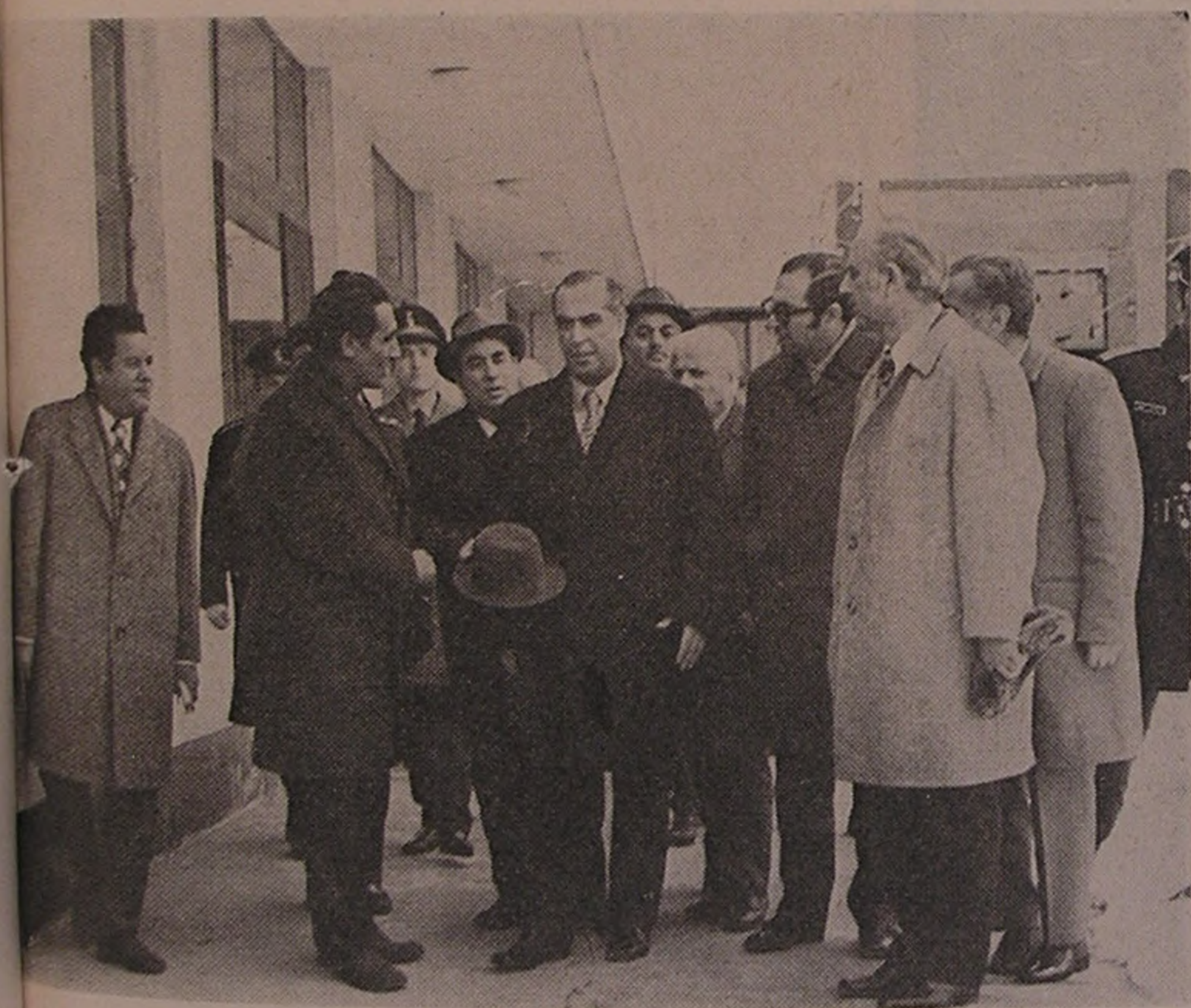
میاندوآب . . . بازدید از بیمارستان شیر و خورشید سرخ