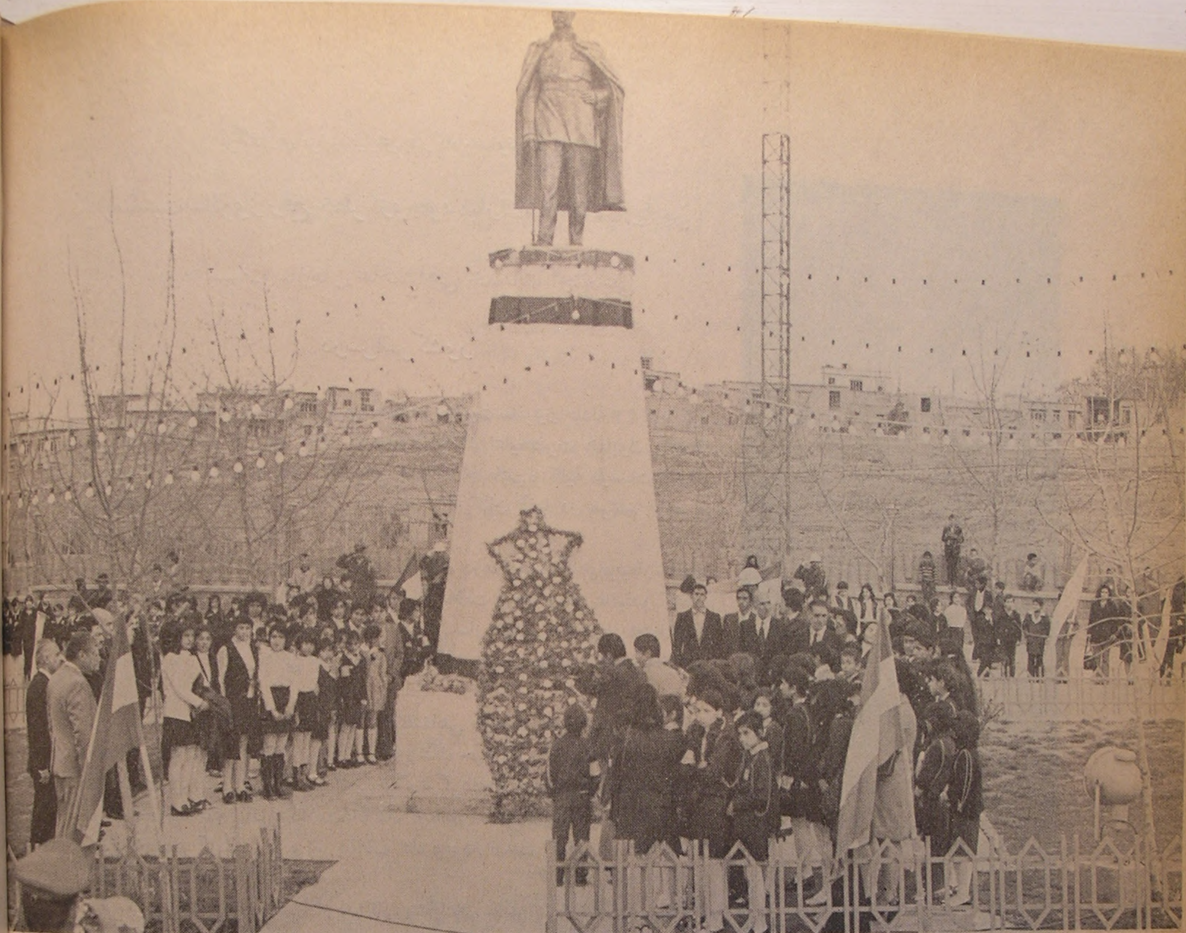
کرمانشاه . . . گلباران نمودن بیکره اعلیحضرت رضاشاه کبیر