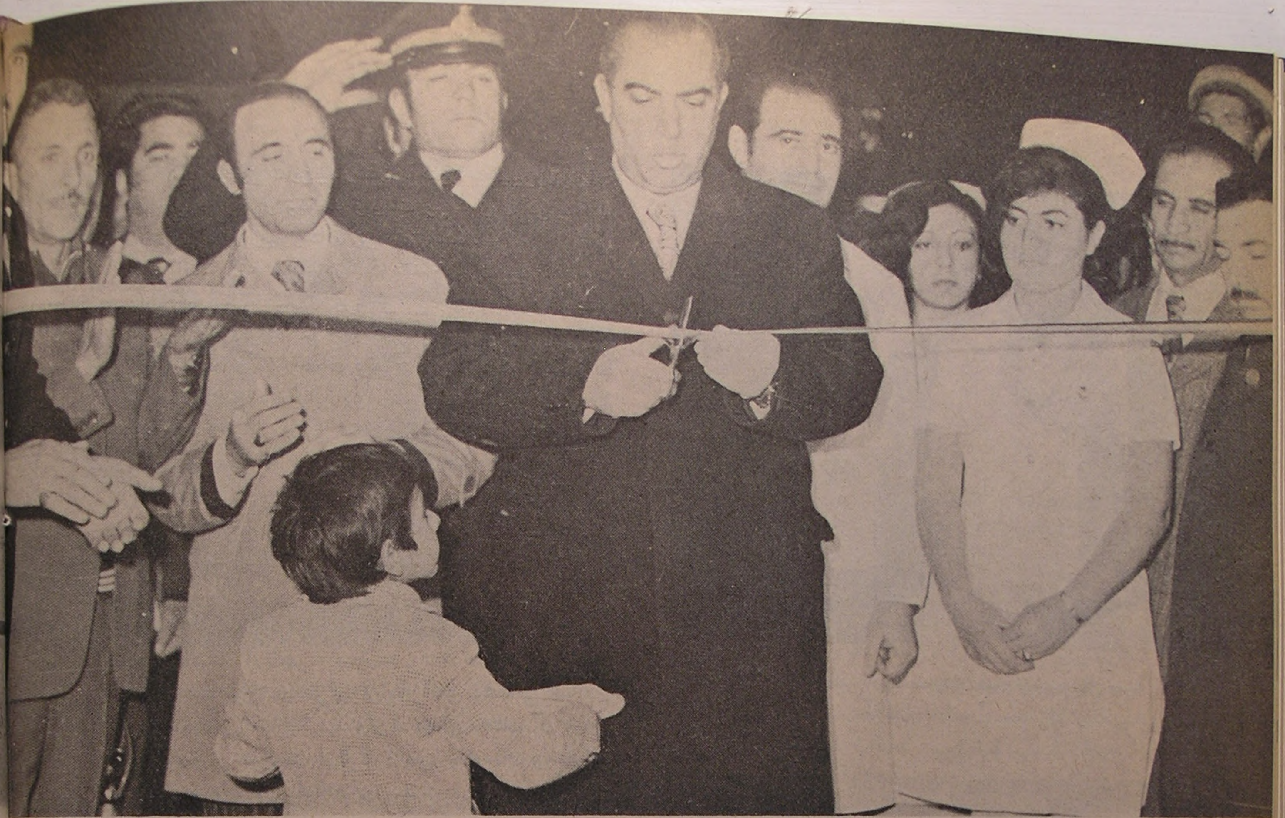
بنام نامی اعلیحضرت همایون شاهنشاه آریامهر بیمارستان امدادی کورش کبیر وابسته به جمعیت شیروخورشید سرخ نقده افتتاح میشود