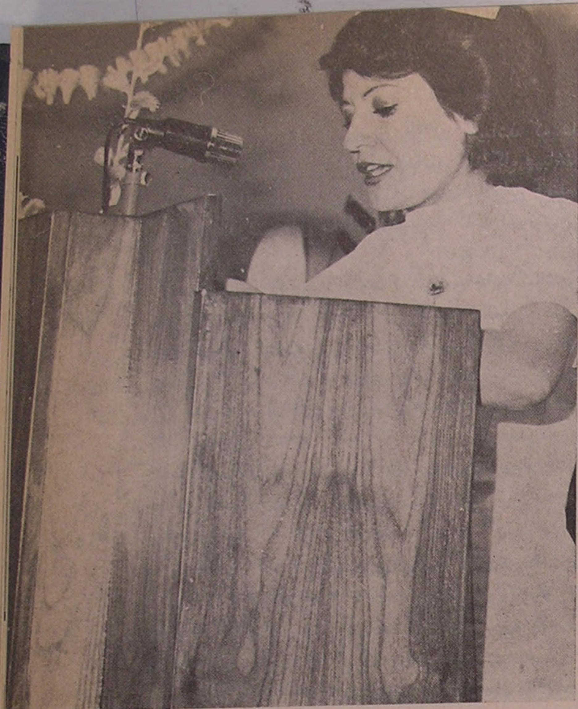
سرپرست آموزشگاه عالی پرستاری رضاشاه کبیر هنگام سخنرانی

موقع را مغتنم شمرده مختصر گزارشی در مورد وضعیت این مدرسه باستحضار میرساند: