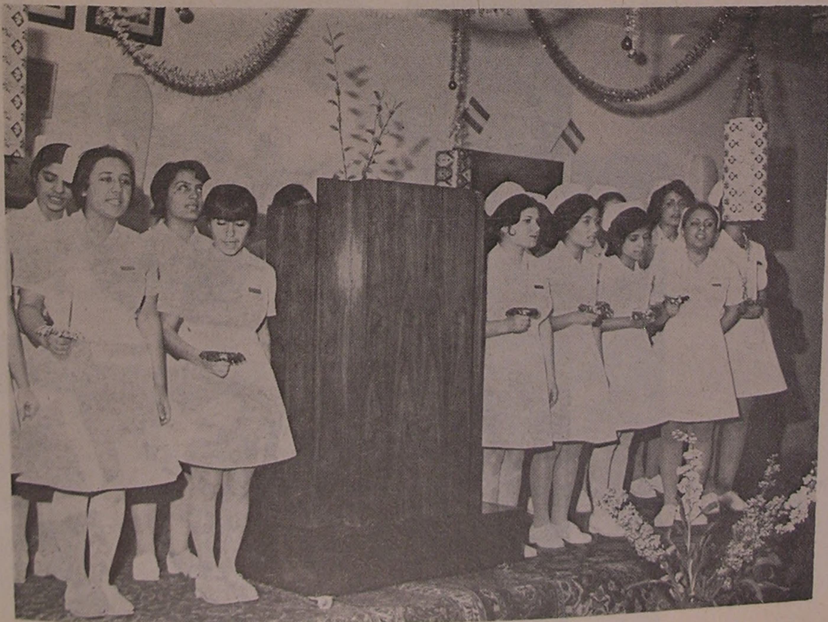
اجرای مراسم مخصوص از طرف دانشجویان آموزشگاه پرستاری رضاشاکبیر

«انجمن دانشجویان» این مدرسه از سال ۱۳۳۸ تأسیس گردیده و فعالیتهایش در زمینه‌های مختلف امور دانشجویی از طریق کمیته‌های متعدد تحت نظارت مریبان مشاور ادامه دارد و دونفر از نمایندگان انجمن دانشجویان این مدرسه، تاکنون در «کنگره بین‌المللی پرستاران» که در کشورهای «آلمان» و «کانادا» در سالهای ۱۳۴۴ و ۱۳۴۸ تشکیل شده شرکت نموده‌اند و در اردیبهشت ماه ۱۳۵۲ نیز نماینده دیگری