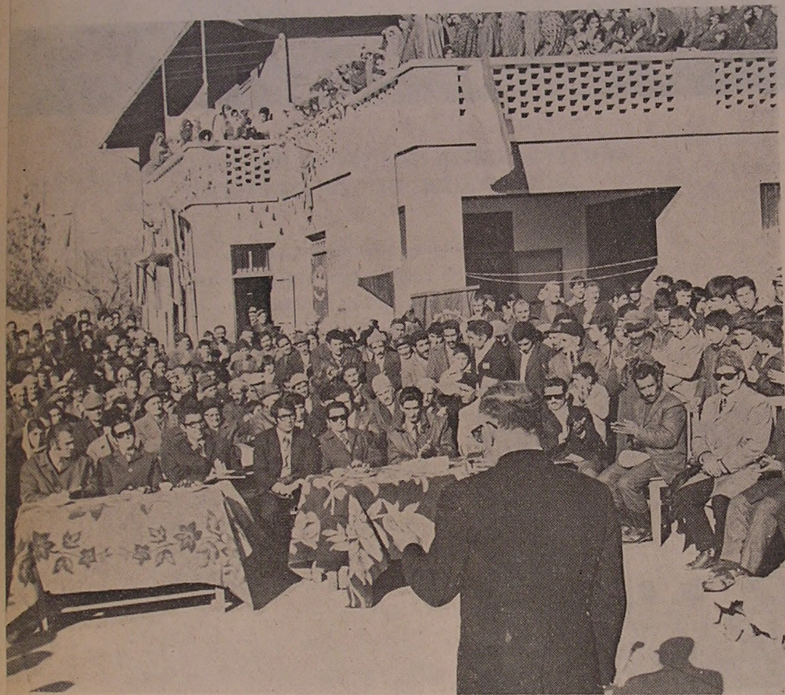
فیروزکوه . . . منظره‌ای از مجلس جشن شیرو خورشید سرخ فیروزکوه