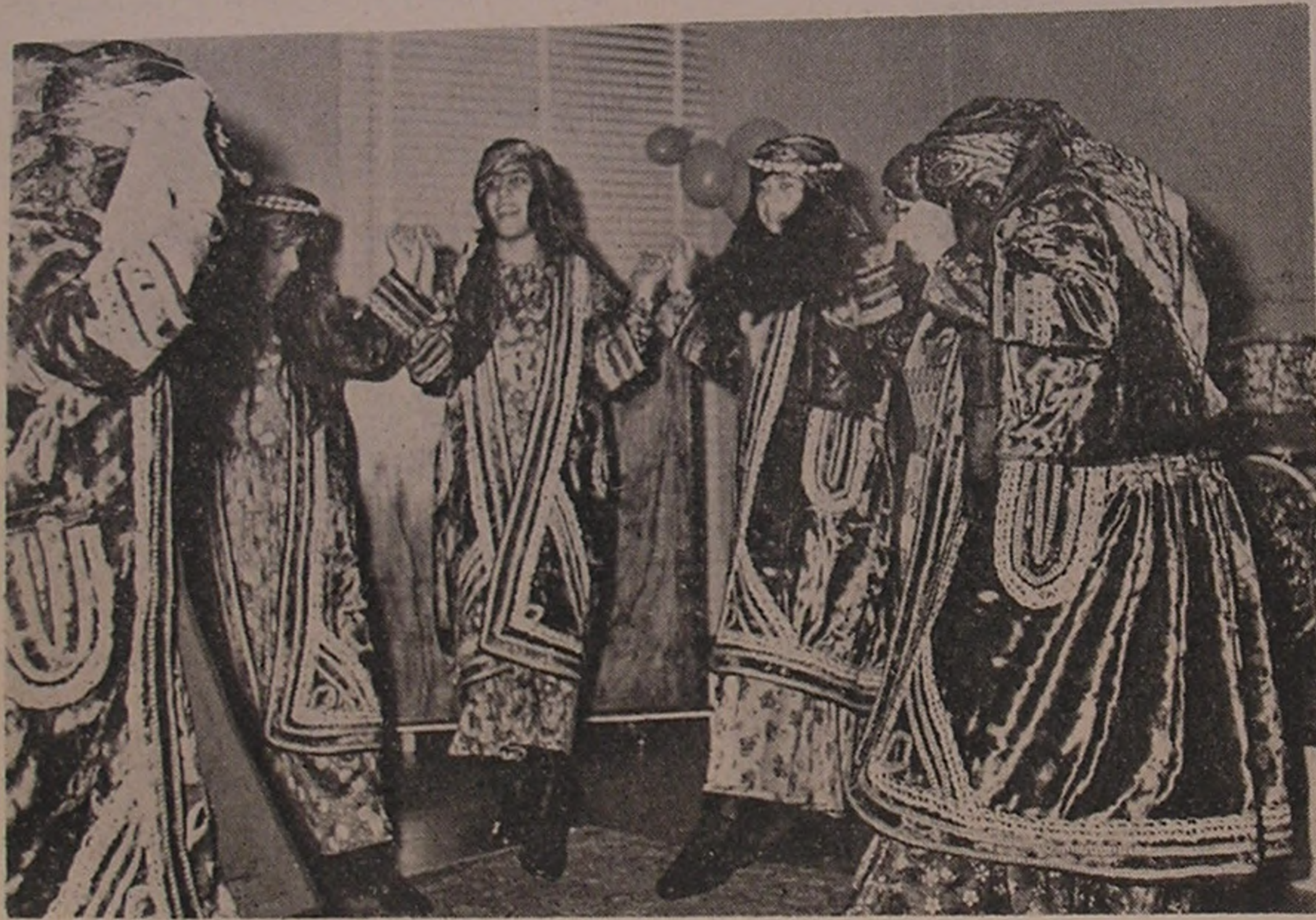
خرم آباد لرستان . . . اجرای برنامه هنری وسیله دوشیزگان عضو سازمان جوانان