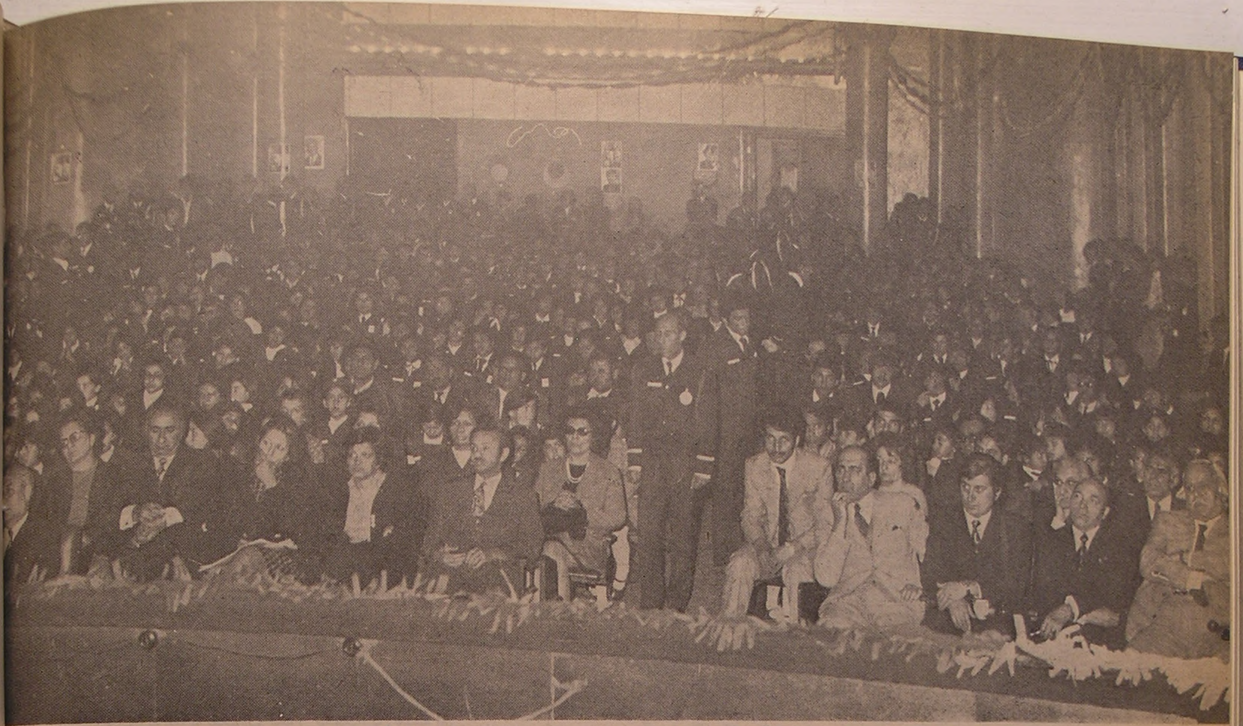
منظره‌ای از مجلس نیایش جمعیت شیروخورشید سرخ ایران در تالار فرهنگ