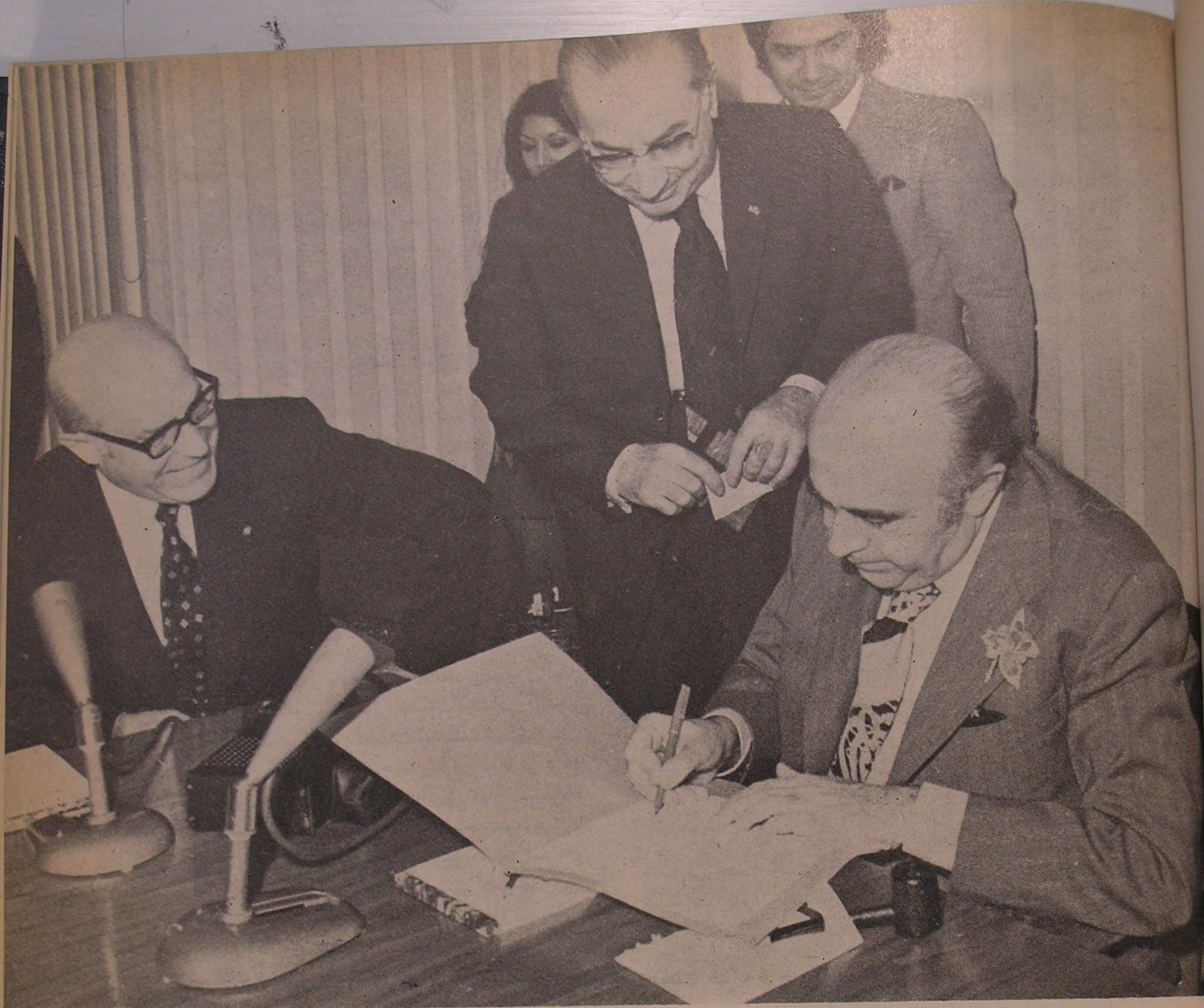
آقایان هویدا نخست وزیر و مهندس جعفر شریف امامی ریاست مجلس سنا و نیابت تولیت موقوفات بنیاد پهلوی و سناتور اشرف احمدی معاون بنیاد پهلوی در پایان جلسه هیئت نظارت بر موقوفات بنیاد پهلوی

بهریک از استانها و فرمانداریهای کل کشور هزینه ساختمان يك دبستان روستائی جمعاً ۲۲ دبستان بمبلغ ۶۶۰۰۰۰۰ ریال اهداء گردید و از طرف کارکنان بنیاد پهلوی نیز بهای ساختمان يك دبستان پرداخت شد و ضمناً فعالیتهای ثمر بخش و مفید و عام المنفعه اجتماعی و مذهبی در سال مزبور ادامه داشت که اینک رؤس اقدامات انجام شده را بشرح زیر باستحضار میرساند :