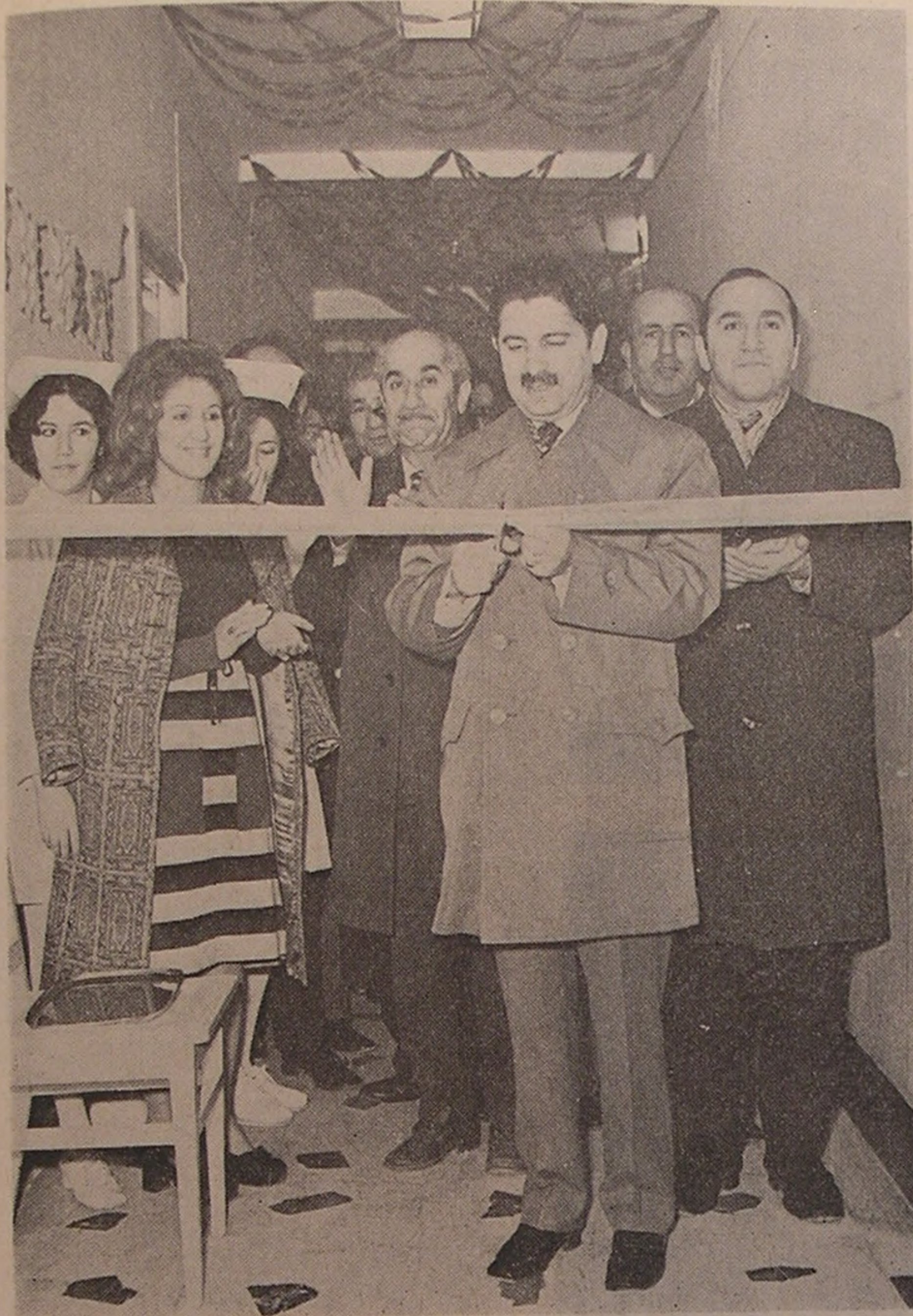
بنام نامی اعلیحضرت همایون شاهنشاه آریامهر بخش نوتوانی بیمارستان شیر و خورشید سرخ شاهرود افتتاح میشود

بر زمین زدن اولین کلنگ ساختمان آموزشگاه بهیاری و گشایش بخش نوتوانی جمعیت شیر و خورشید سرخ شاهرود