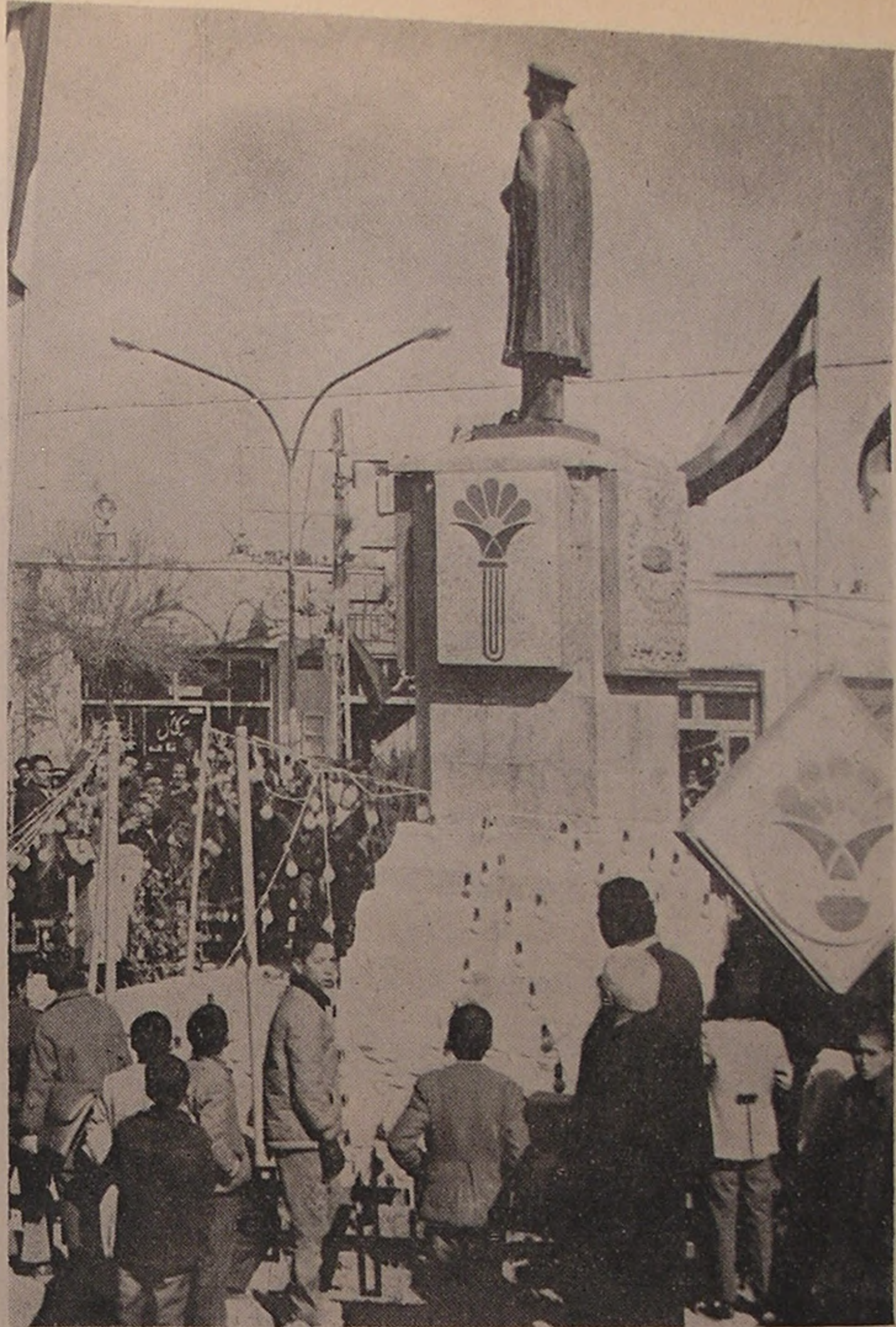
آباده . . . گلباران نمودن پیکرهٔ اعلیحضرت رضاشاه کبیر