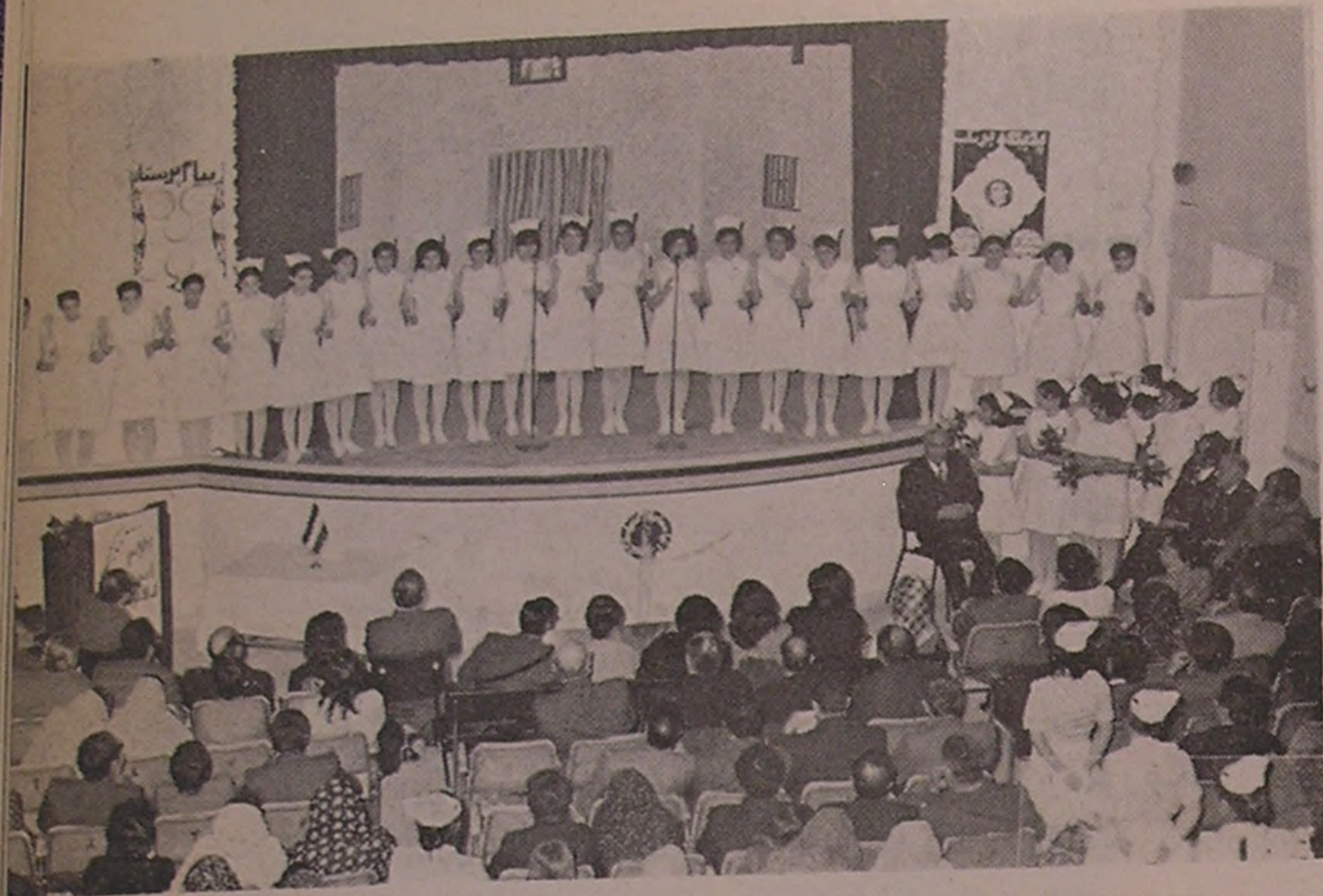
زنجان . . . ادای سوگند پرستاری