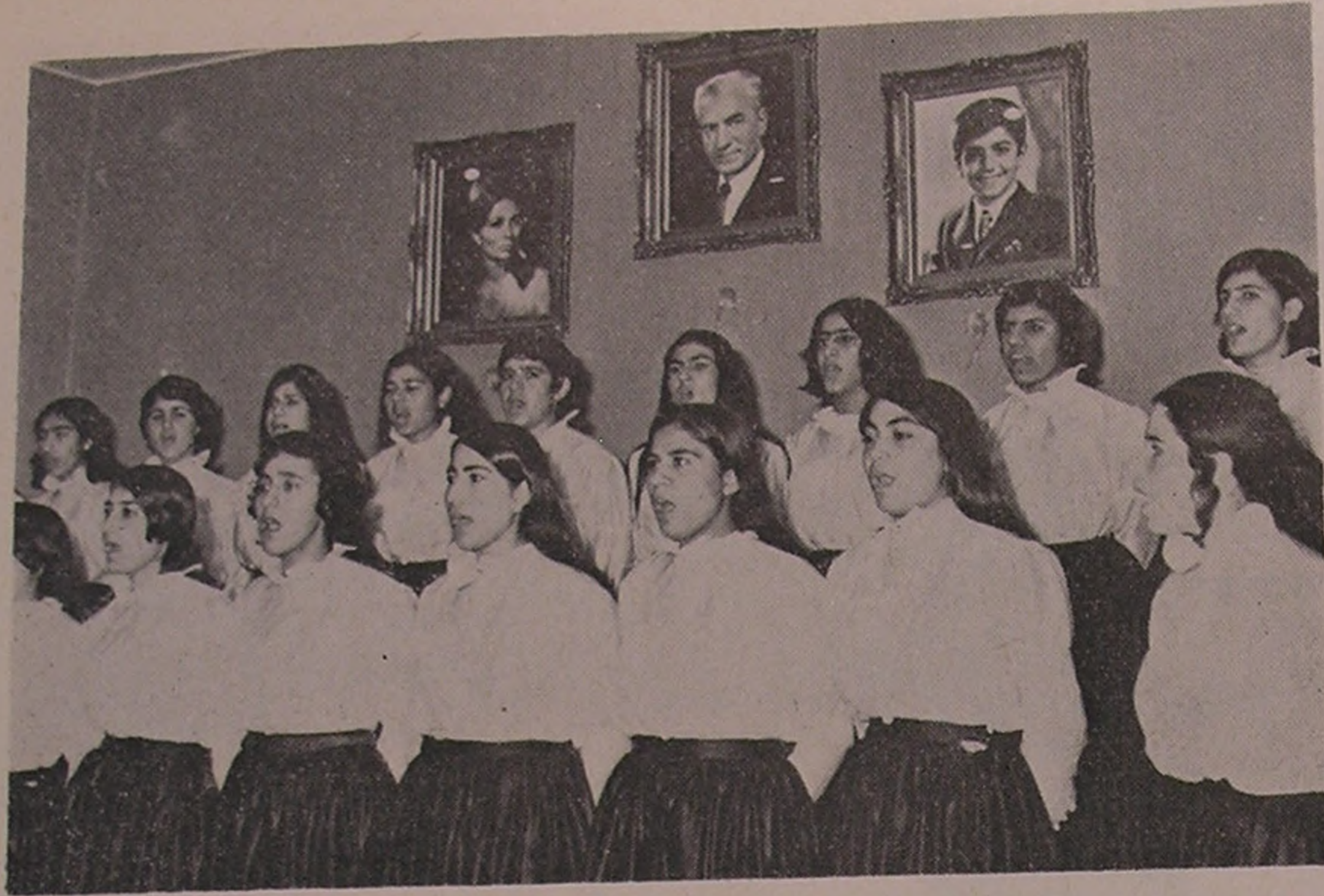
خرم آباد لرستان . . . سرایش سرود شیر و خورشید سرخ وسیله دوشیزگان عضو سازمان جوانان