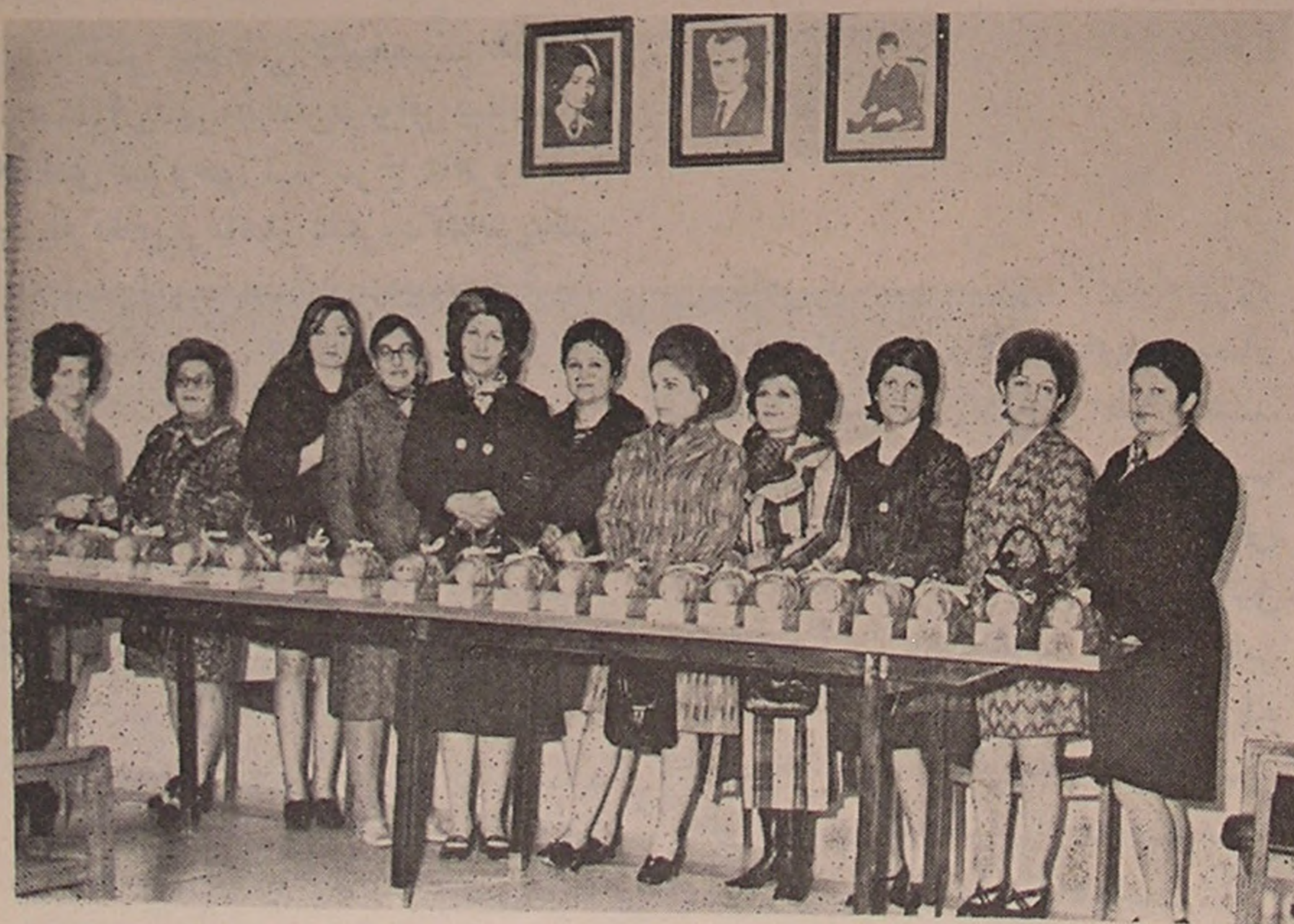
خرم آباد لرستان . . . آماده نمودن هدایای شیر و خورشید سرخ برای توزیع در بیمارستانها