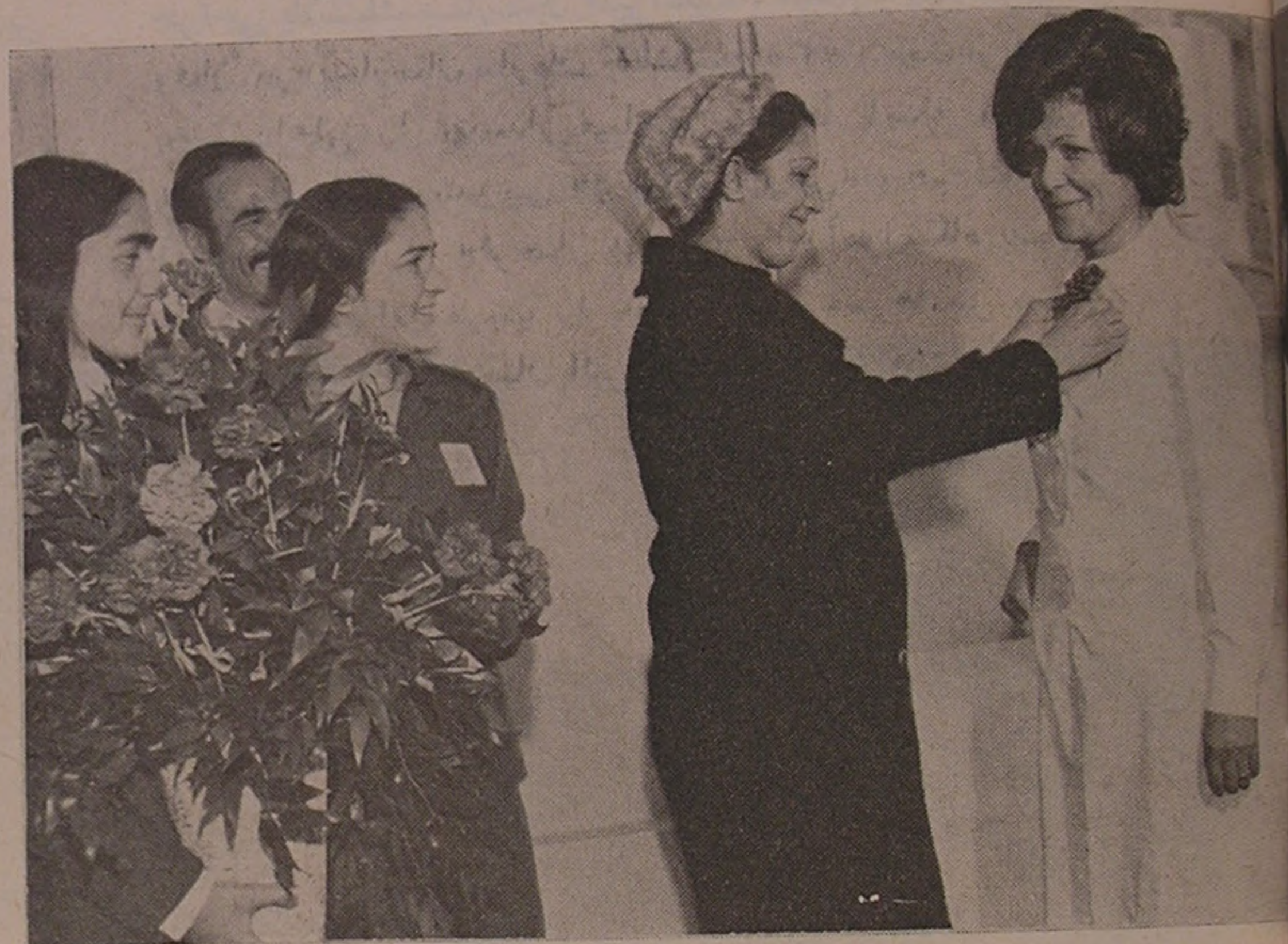
همدان . . . نصب شاخه‌های گل به سینه پرستاران