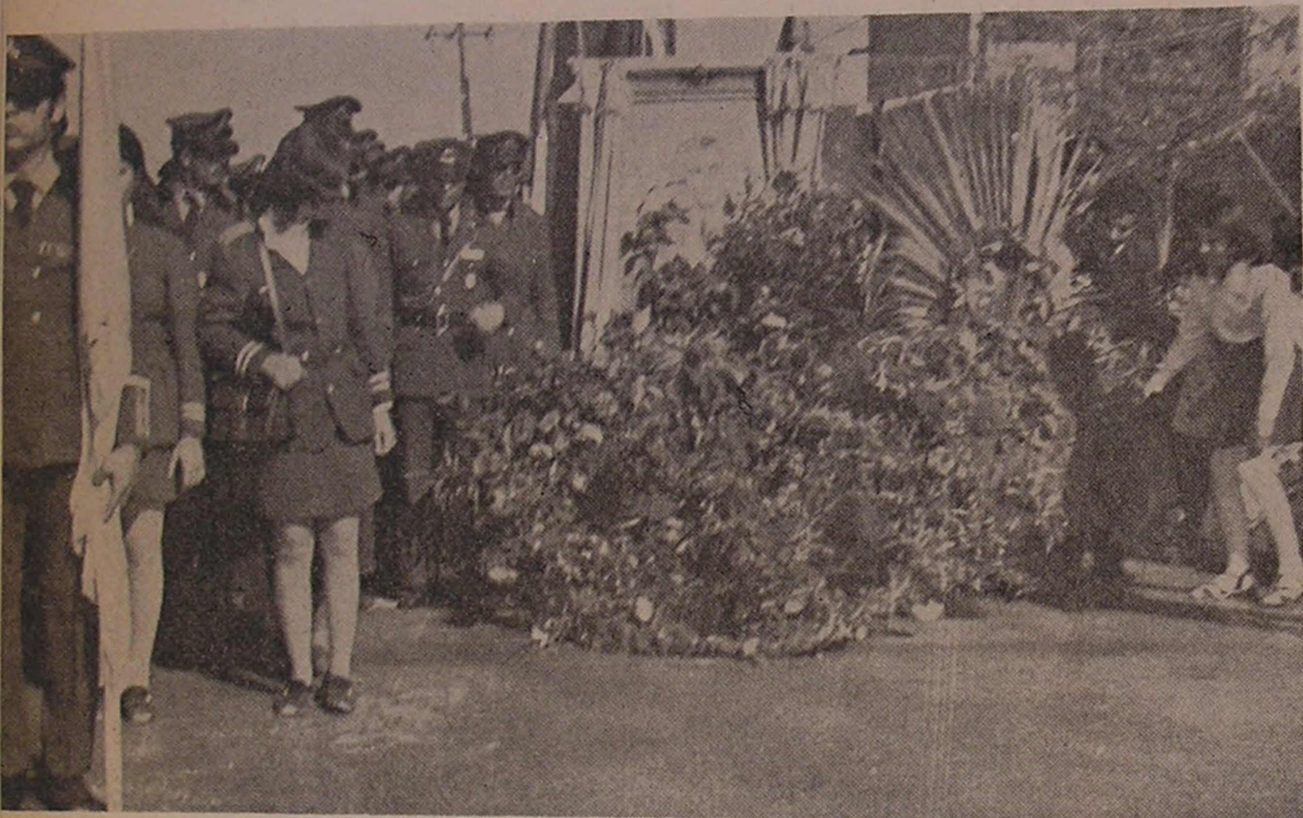
رامهرمز . . . گلباران نمودن تمثال شاهنشاه آریامهر