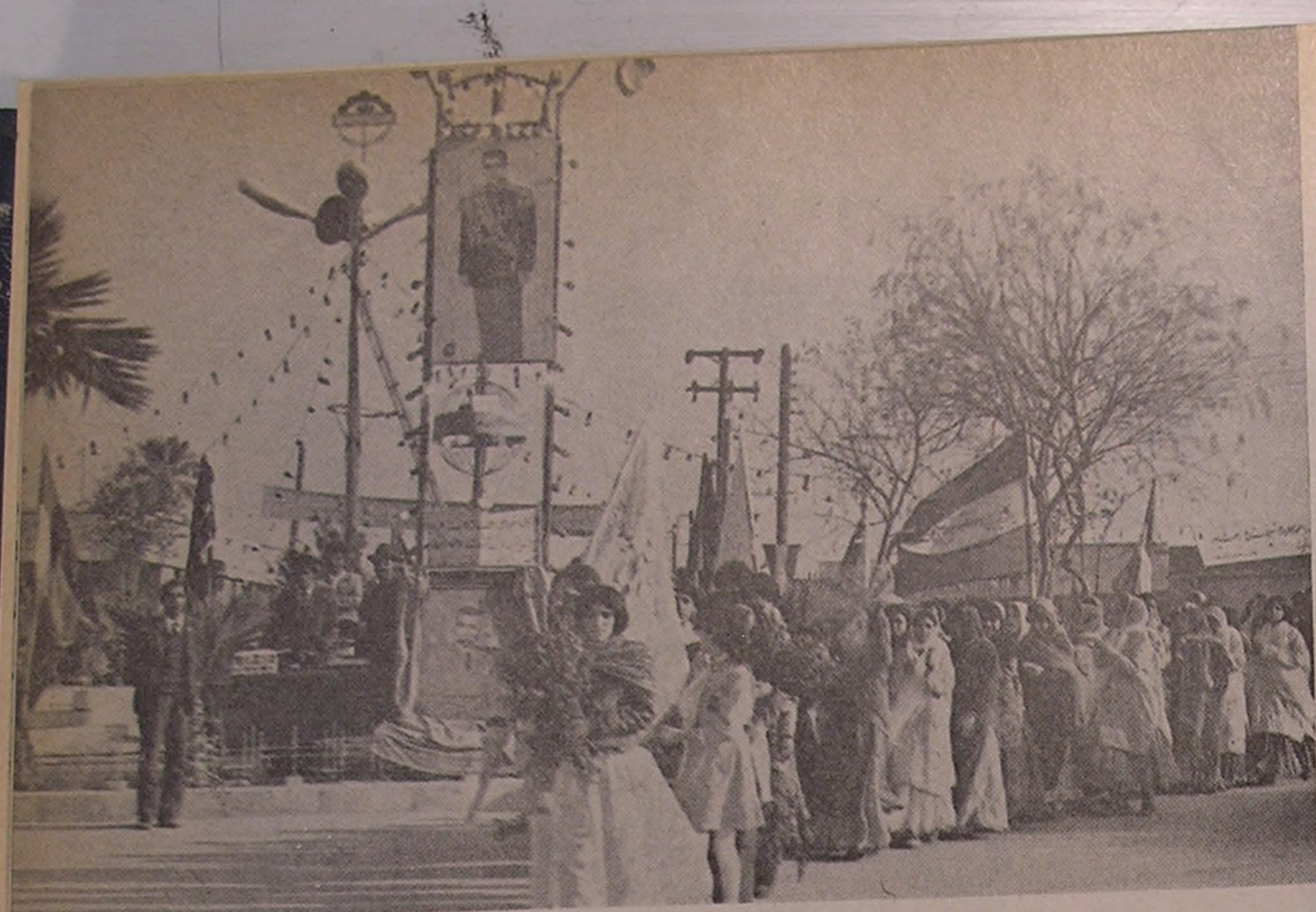
رامهرمز . . . شرکت در دمو نستر اسیون عمومی