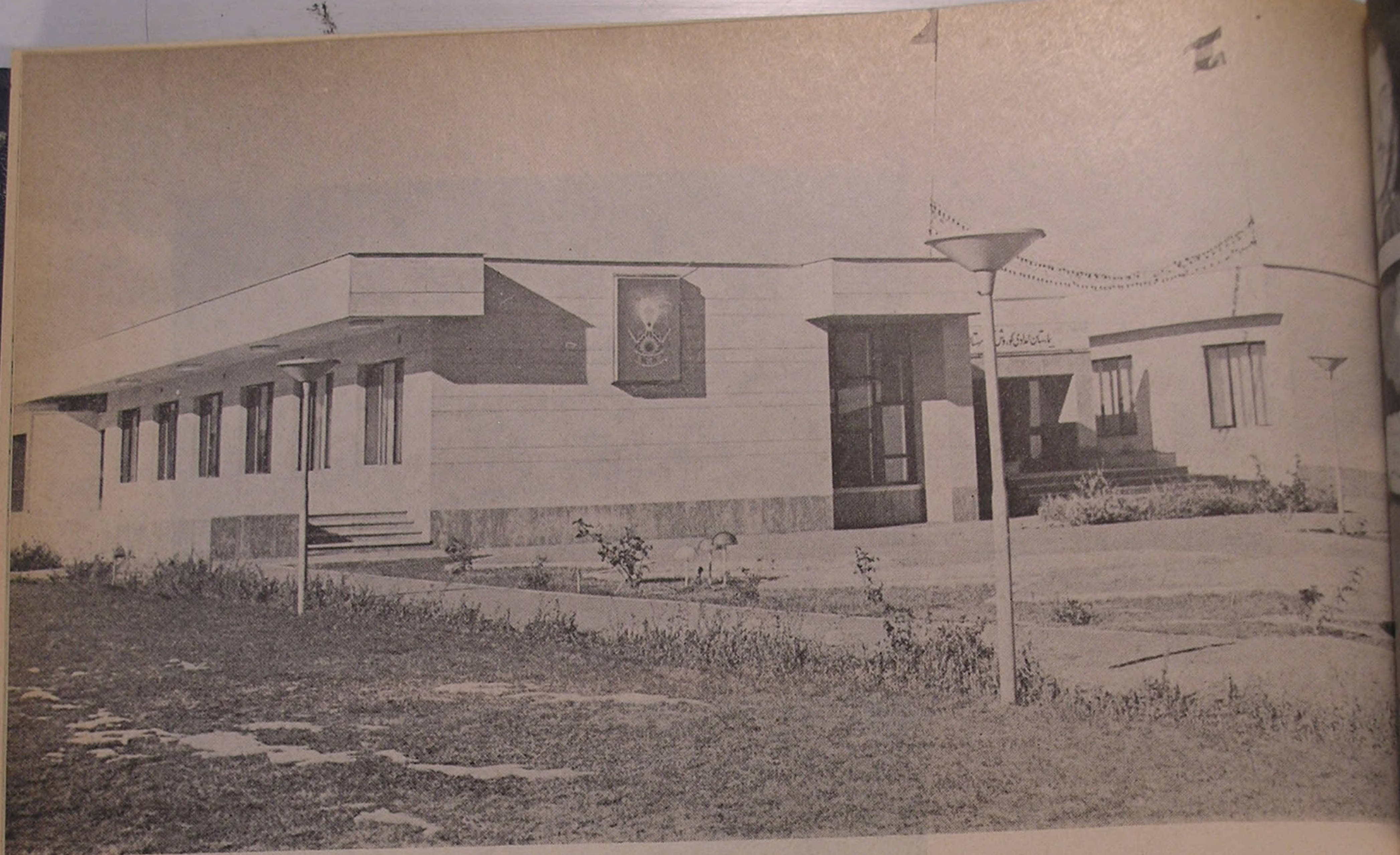
منظره‌ای از ساختمان بیمارستان امدادی کورش کبیر وابسته به جمعیت شیروخورشید سرخ نقده

استفاده میشود، با ساختمان خانه «پزشک و بهیاران و درمانگاه و آزمایشگاه» که اعتبار آن از طرف جمعیت محترم مرکزی کل تأمین و پرداخت گردیده و از سال ۵۰ مورد استفاده قرار گرفته و زیر بنای آن با دو دستگاه دیگر ۲۴۸۰ متر است، بدین شرح میباشد: