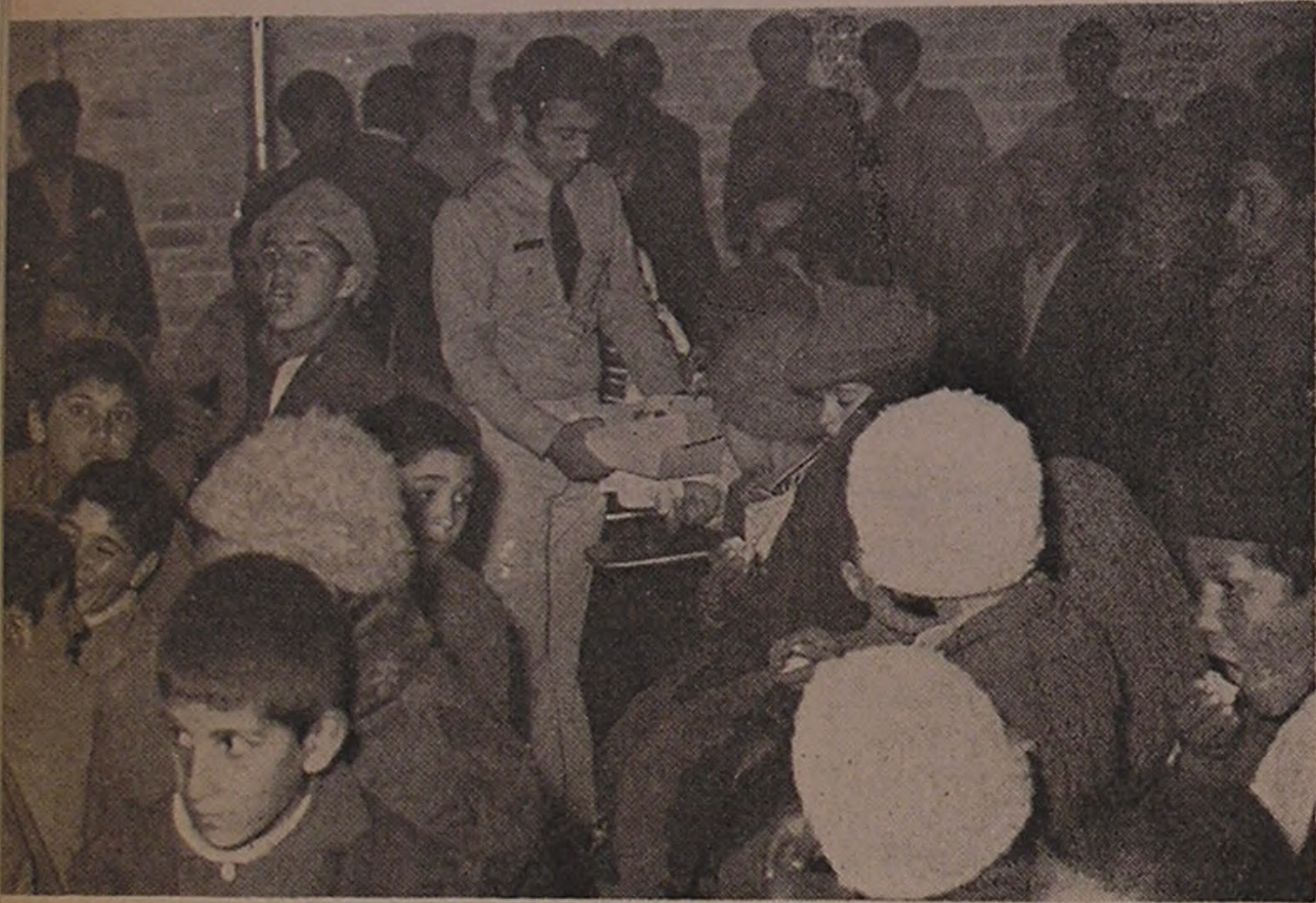
توزیع شیرینی بین شرکت کنندگان در مجلس نیایش در بهکده راجی

انقلاب شاه و مردم، برای اجتماع کنندگان توسط رئیس آسایشگاه تشریح گردید. این مراسم با ابراز احساسات شدید کلیه بیماران و کارمندان آسایشگاه، نسبت به شاهنشاه آریامهر و شهبانوی گرامی و ولیعهد والاگهر و خاندان جلیل سلطنت پهلوی پایان پذیرفت.