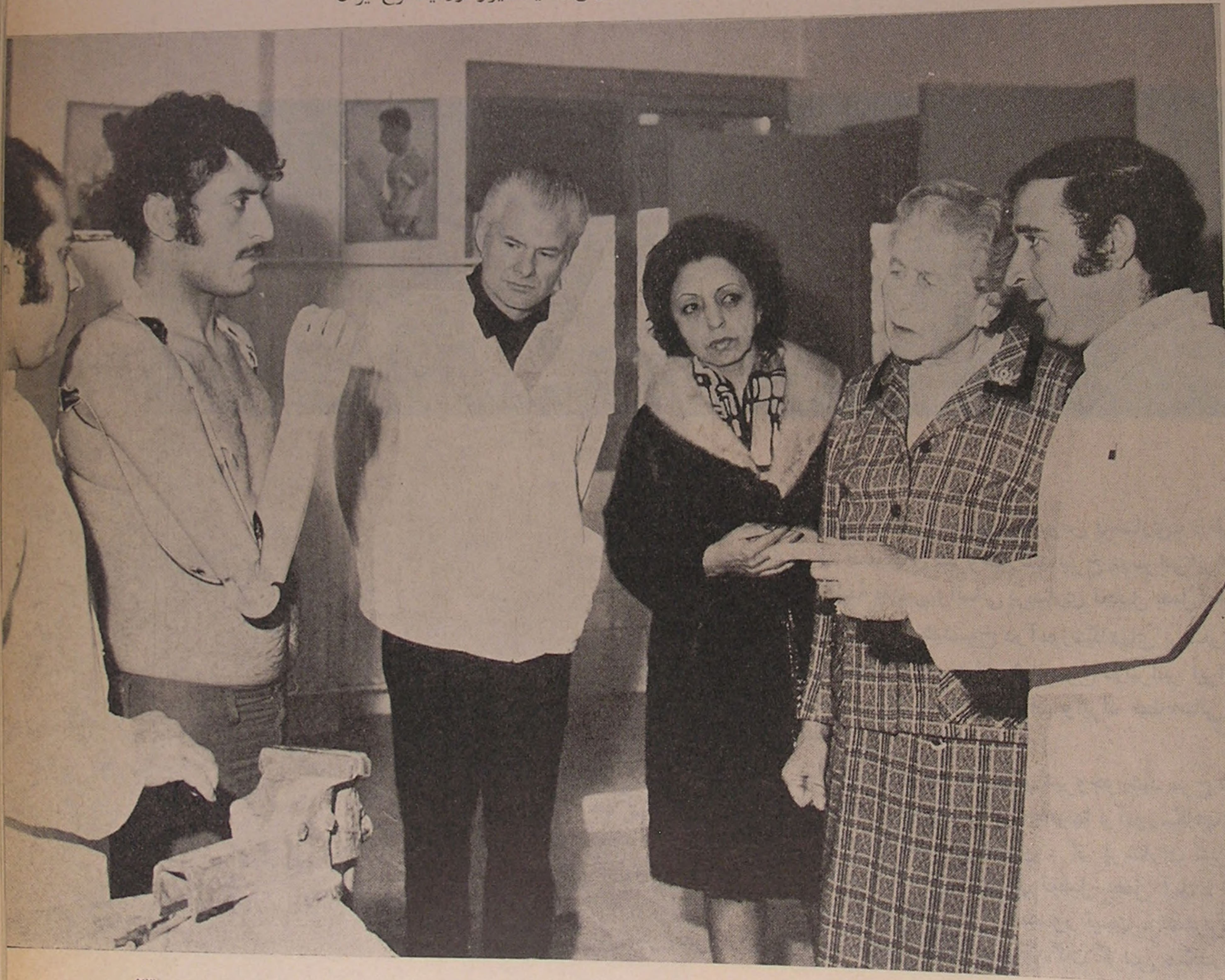
بازدید بانو کنتس لیمریک از مؤسسهٔ دست و پا سازی مصنوعی جمعیت شیر و خورشید سرخ ایران

هنگام اقامت «خانم کنتس لیمریک» در تهران، از طرف