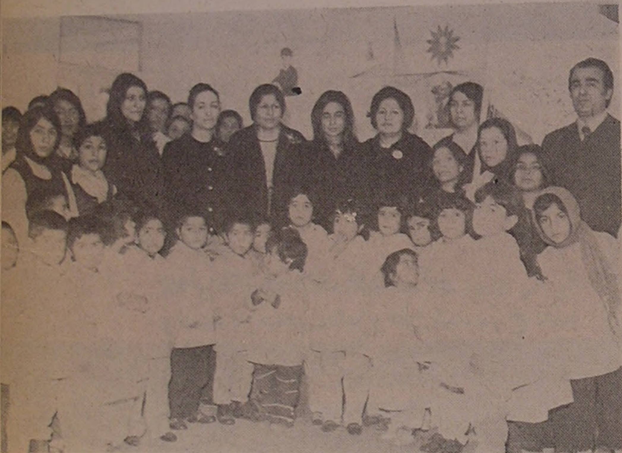
دامغان . . . دیدار از اطفال شبانه روزی