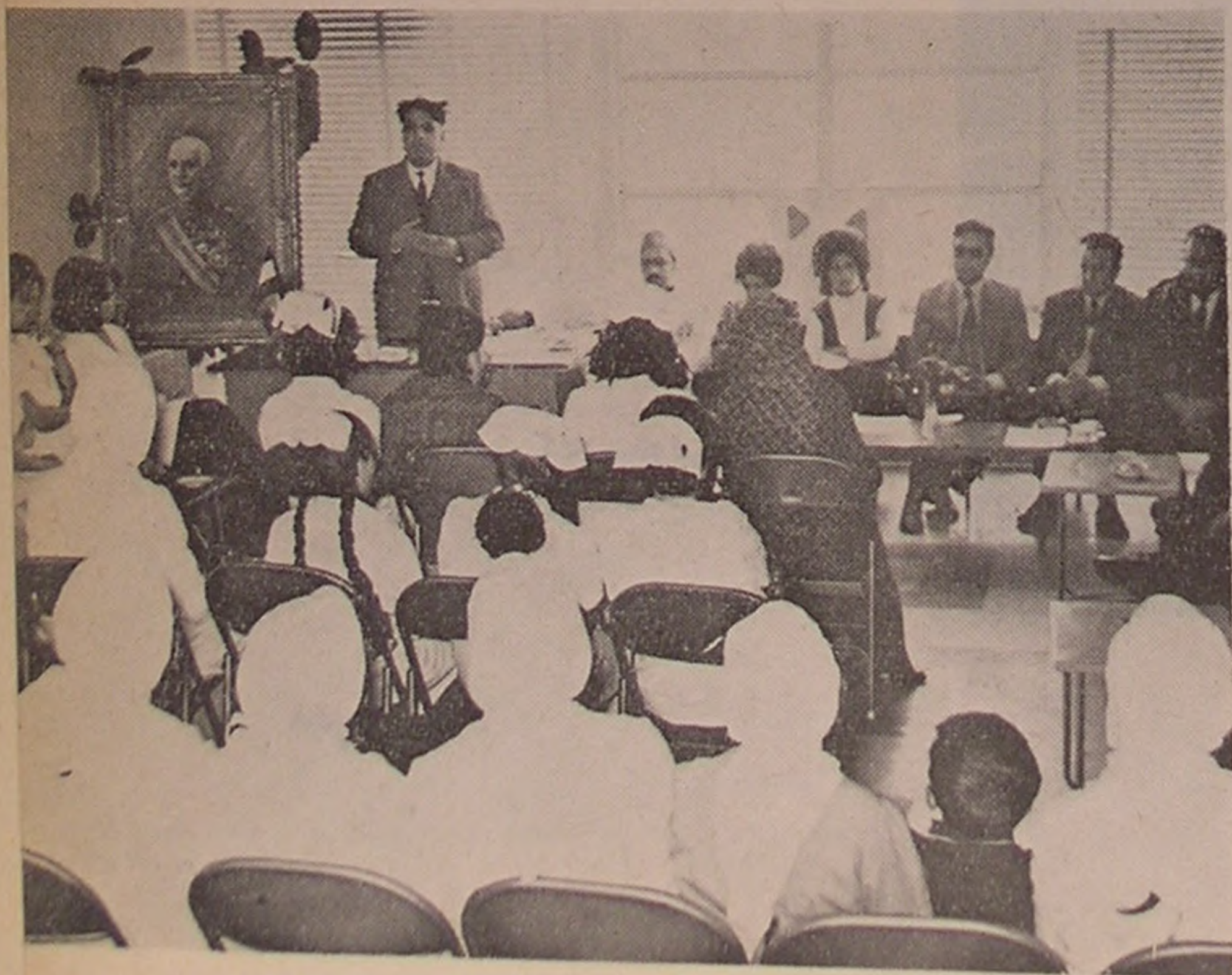
شاهپور . . . منظره‌ای از مجلس جشن شیرو خورشید سرخ شاهپور