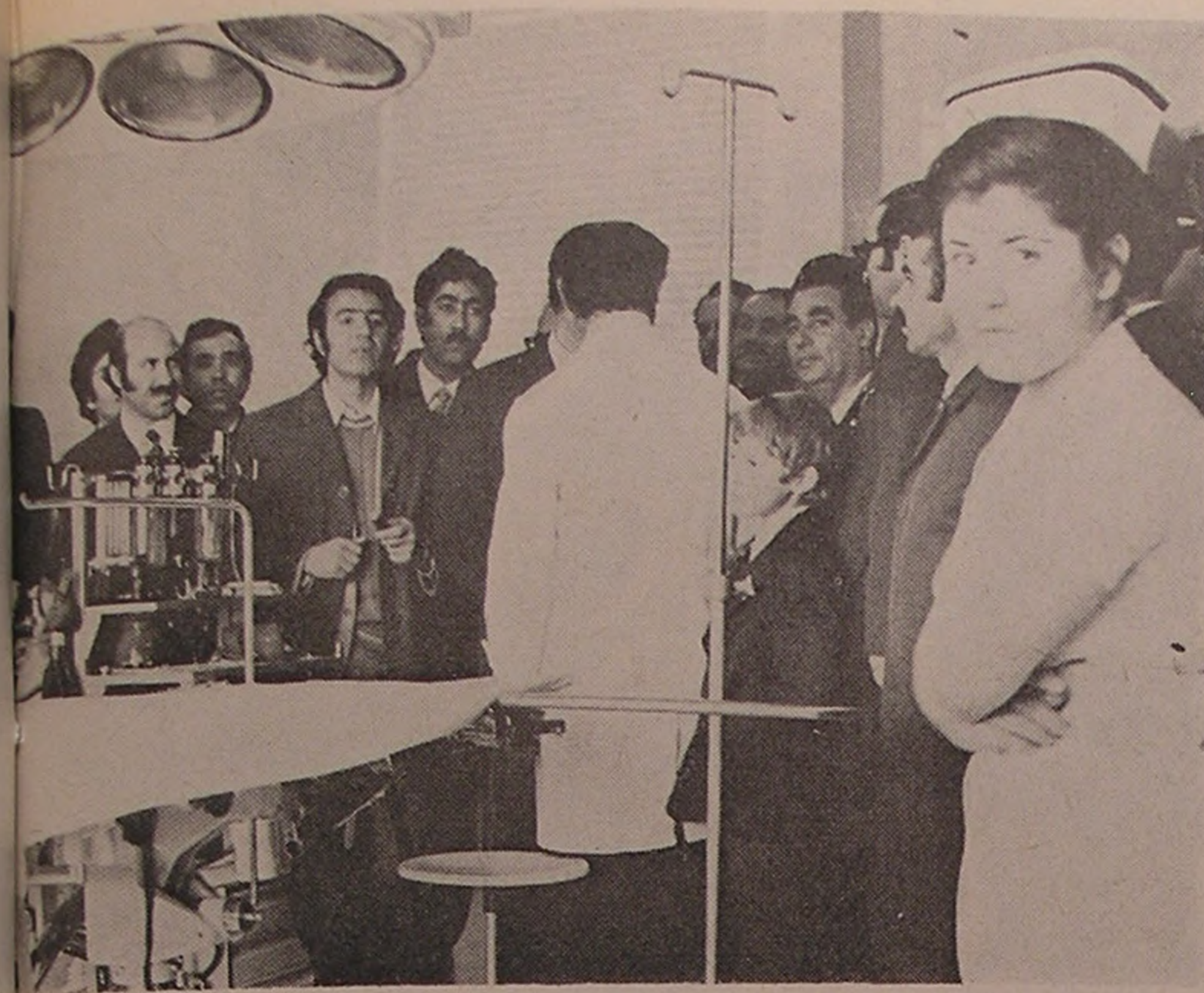
میاندوآب . . . بازدید از بیمارستان شیر و خورشید سرخ