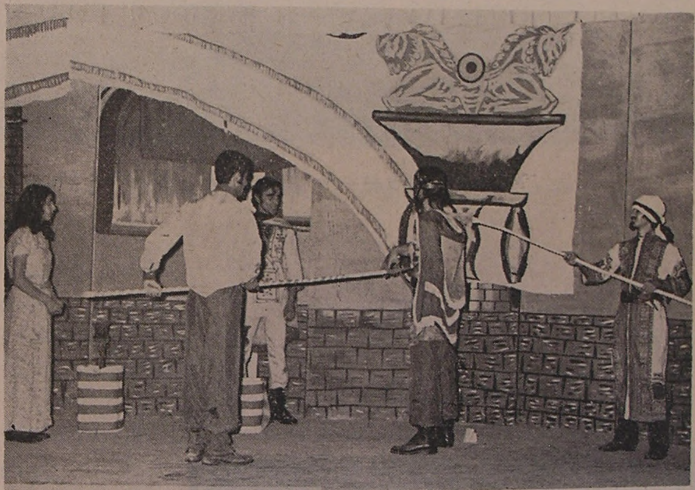
شہسوار . . . اجرای برنامه هنری وسیلہ جوانان شیر و خورشید سرخ