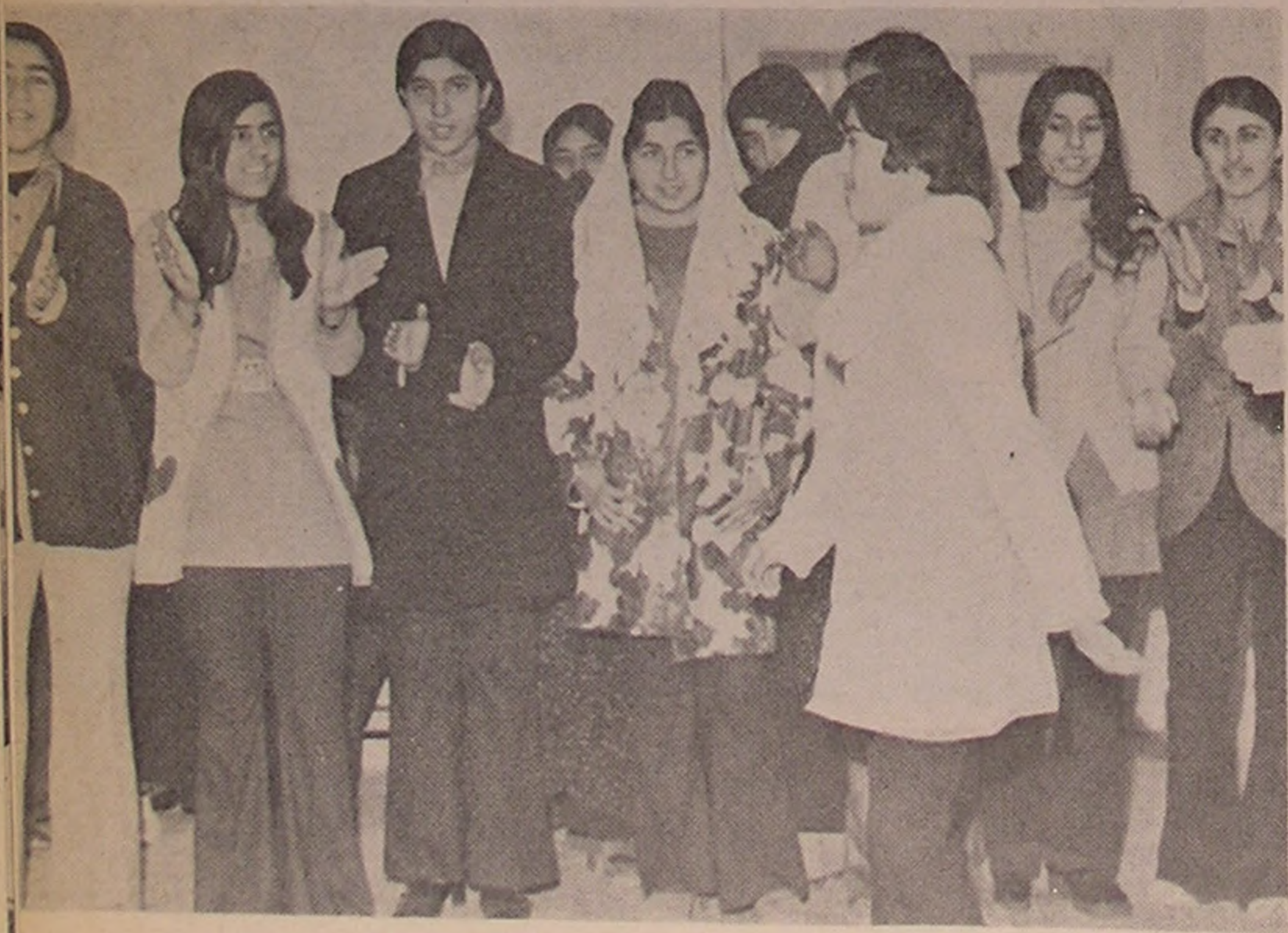
دامغان . . . اجرای برنامه هنری

هزینه تجهیزات این بیمارستان تا کنون سه میلیون و نهصد و هفتاد و چهار هزار و یکصد و بیست و یک ریال گردیده که از طرف اداره امور بیمارستانها پرداخت شده .