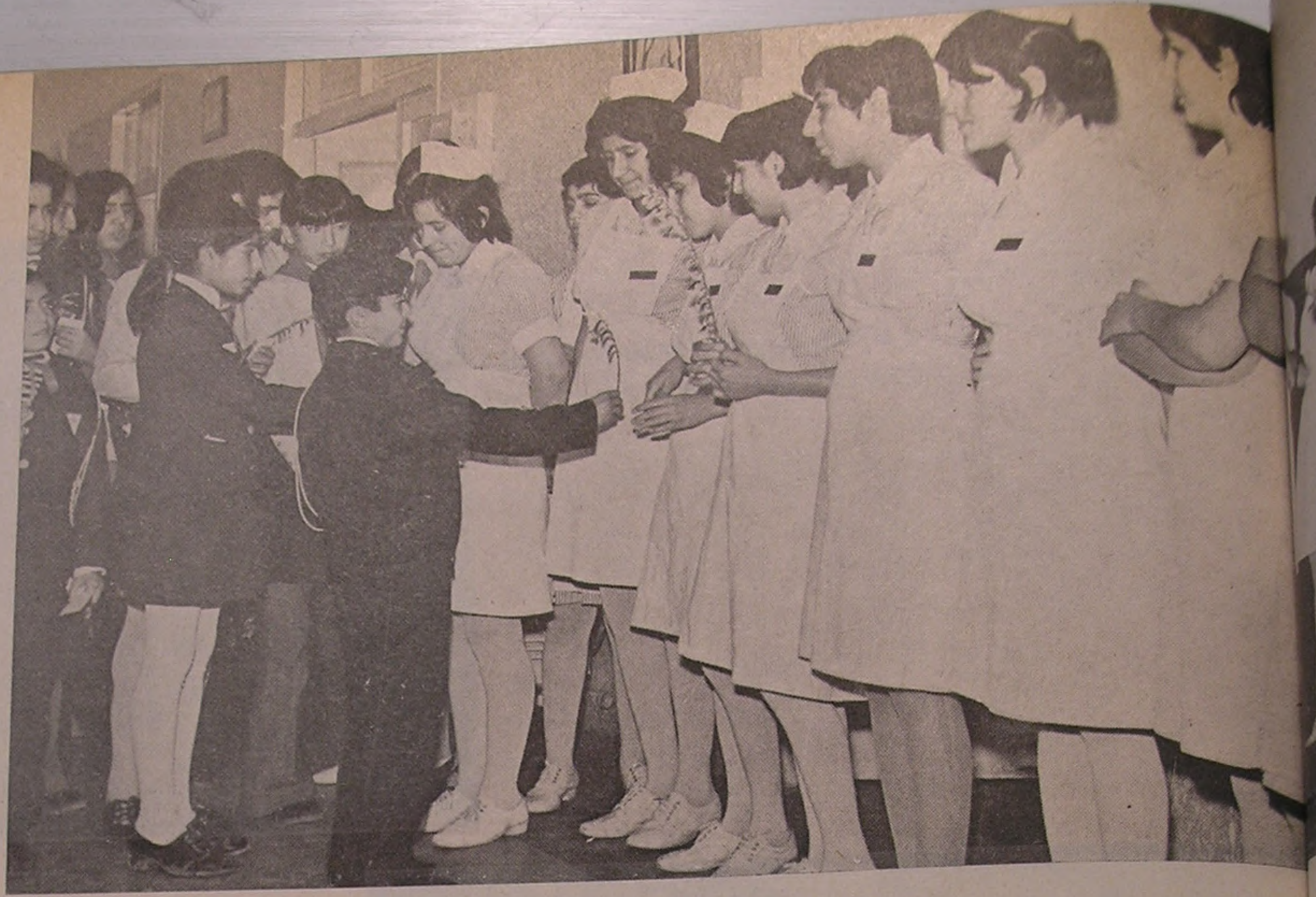
سمنان . . . اهداء شاخه‌های گل به پرستاران وسیله جوانان شیروخورشید سرخ