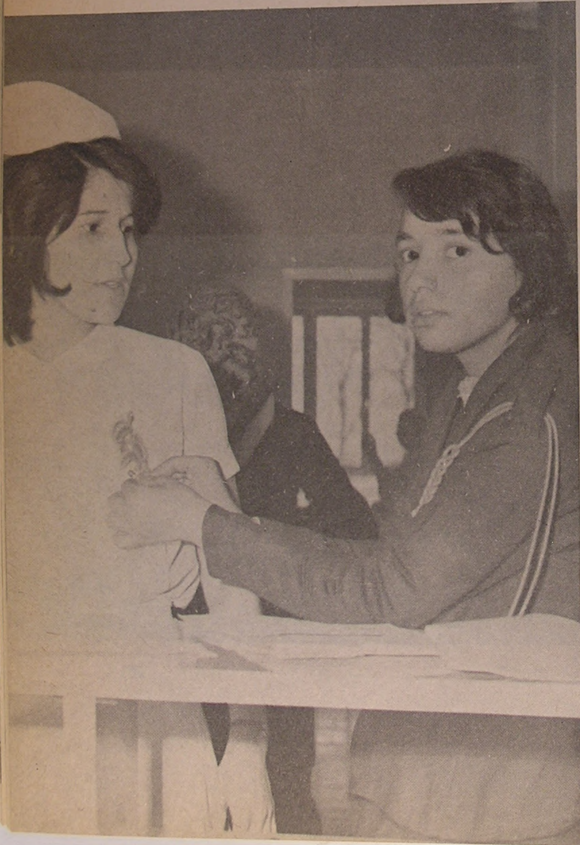
شاهرود . . . اهداء گل به پرستاران وسیله جوانان شیروخورشید سرخ

طی ، ایران مل آمد. ستاری ایران هائی ، رخ در فاههای شیرو د . بویری گذرد. بوی نامه