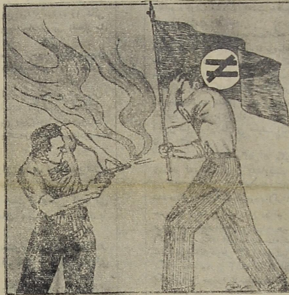
پرچمدار پرچم را رها نکرد

از آترمان که برومند جوانان ایران زمین سازمان مقدس بان ایرانیست را بنیان نهادند و جهاد تند و شدید خود را علیه همه دشمنان و کلیه بلیدیه و فساد آغاز کردند. سازمان ما همواره چون خاری بچشم دشمنان فرورفت و از همان هنگام بیگانگان درک کردند که تنها مکتب تربیتی که دست ناپاک اجنبیان را از مرز و بوم ایران کوتاه خواهد ساخت مکتب نجات بخش بان ایرانیست است. بقیه در صفحه ۲