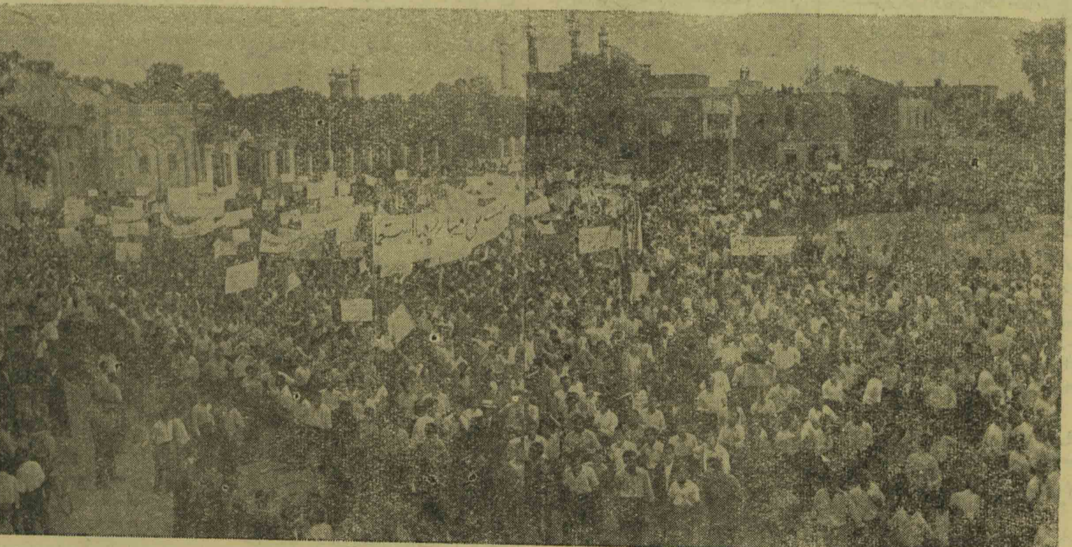
دیر و ز مردم پایتخت پیروزی خود را در مبارزه بر ضد کودتای دربار - استعمار جشن گرفتند و بادامه مبارزه تا پیروزی نهائی پیدان نهادند

دیر و ز بامدادان مردم تهران از شکست توطئه کودتا آگاهی یافتند؛ نهضت اصل ضد استعماری ملت ایران هو شیارانه بوقوع کودتای را که بدست شاه خائن و بفرمان اربابان او بر پاشده بود فاش کرده و عقیم گذاشته بود؛ در این هنگام پایتخت بحرکت آمد، مردم مانند سیل بخیا بانها ریختند تا بار دیگر اراده قاطع خود را در سر کوبی ایندسته سیاه و رسوا اراژ دارند؛ کودتاچیان و توطئه گران سالهاست که بفرمان استعمار و در سایه مامشات دولت؛ خون ملت ایران را میریزند و هر روز دامی در سراسر پیروزی های او می گسترند، اما اینک دشمن در حین انجام خیانت رسوا شده بود؛ دیگر شاه خائن نمی توانست بازم قیافه بقیه در صفحه ۲